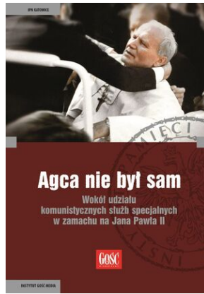
Okładka książki „Agca nie był sam. Wokół udziału komunistycznych służb specjalnych w zamachu na Jana Pawła II”.

W 2020 r. ukazała się włoska edycja unikalnej i znakomitej książki IPN „Agca nie był sam. Wokół udziału komunistycznych służb specjalnych w zamachu na Jana Pawła II”.