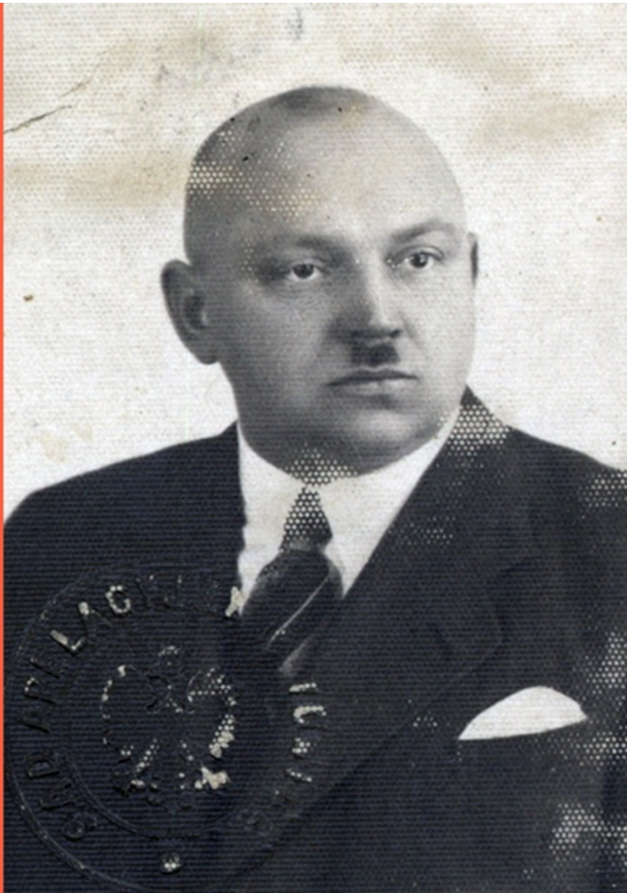
Fotografia Pawła Korzucha, sygn. IPN Ka 454/192, t. 1