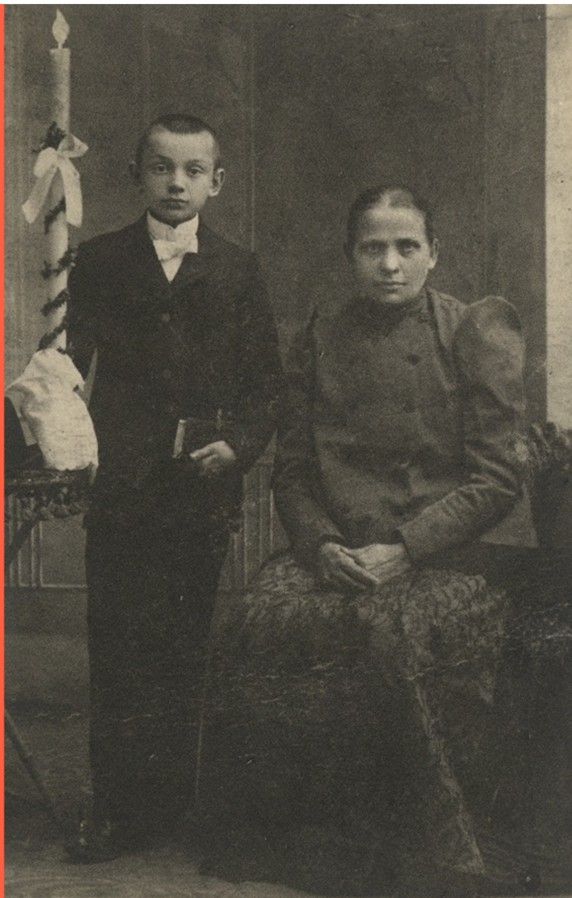
I Komunia Święta Pawła Korzucha, sygn. IPN Ka 454/192, t. 6