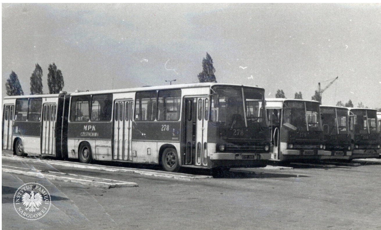
Widok na parking autobusowy na placu zajezdni w Częstochowie, 1988 r. (IPN Ka 09/184, t. 1)

https://gdansk.ipn.gov.pl/pl2/aktualnosci/99681,70-lat-temu-urodzil-sie-ks-Sylwester-Zych-wspolpracownik-Solidarnosci-zamordowan.html )