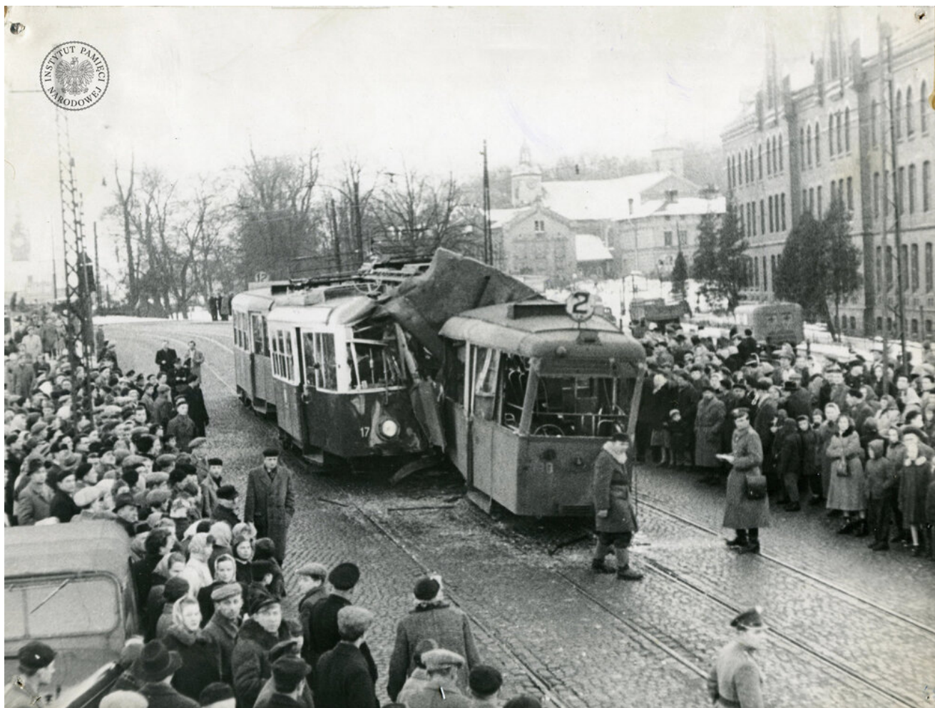
Zderzenie tramwajów w Gdańsku, przy wjeździe na most Błędnik. Data zdarzenia jest nieznana