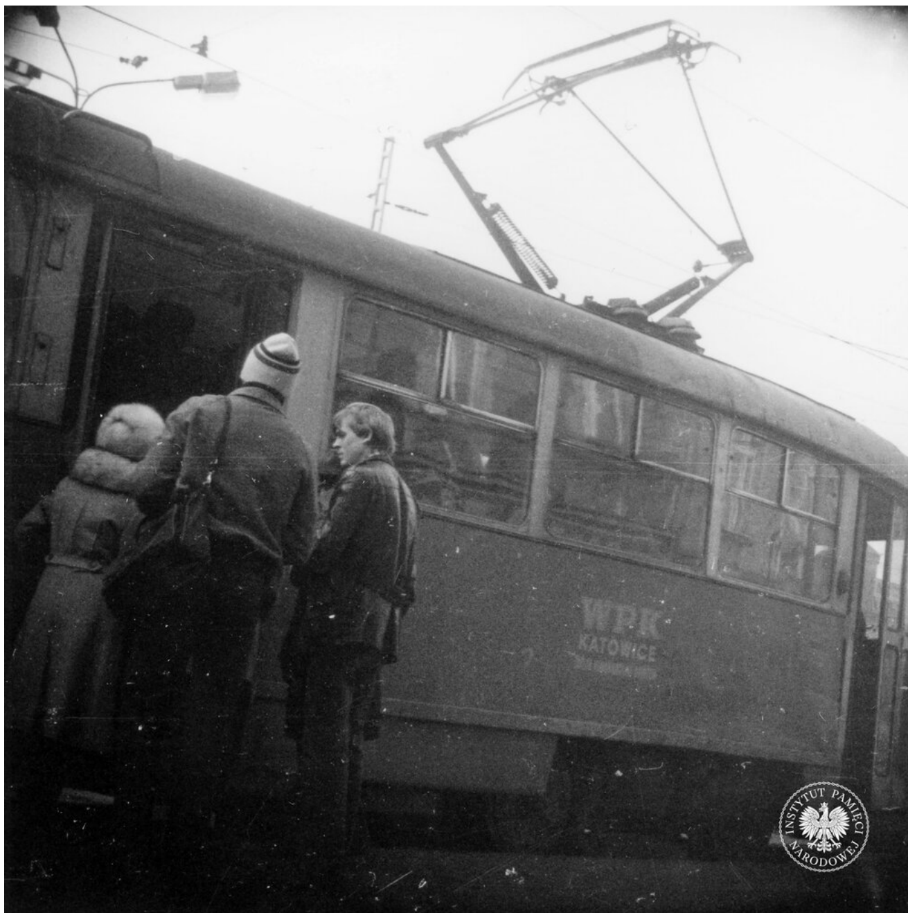
Tramwaj na przystanku przy ul. Armii Czerwonej (obecnie Armii Krajowej) w Chorzowie. Zdjęcie zrobiono podczas obserwacji mężczyzny w czapce (IPN Ka 435/121)