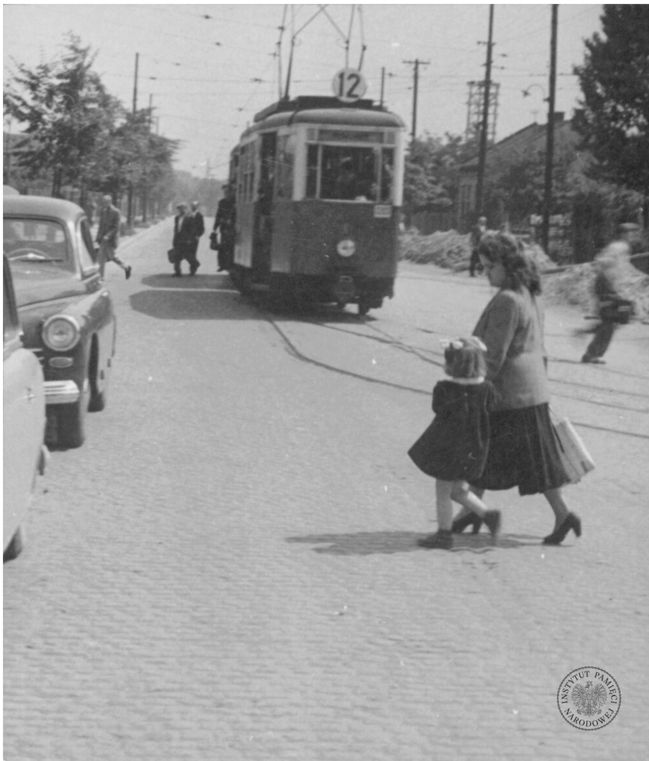
Tramwaj w Krakowie. Zdjęcie zrobiono w latach pięćdziesiątych lub sześćdziesiątych XX wieku (IPN Kr 041/221)