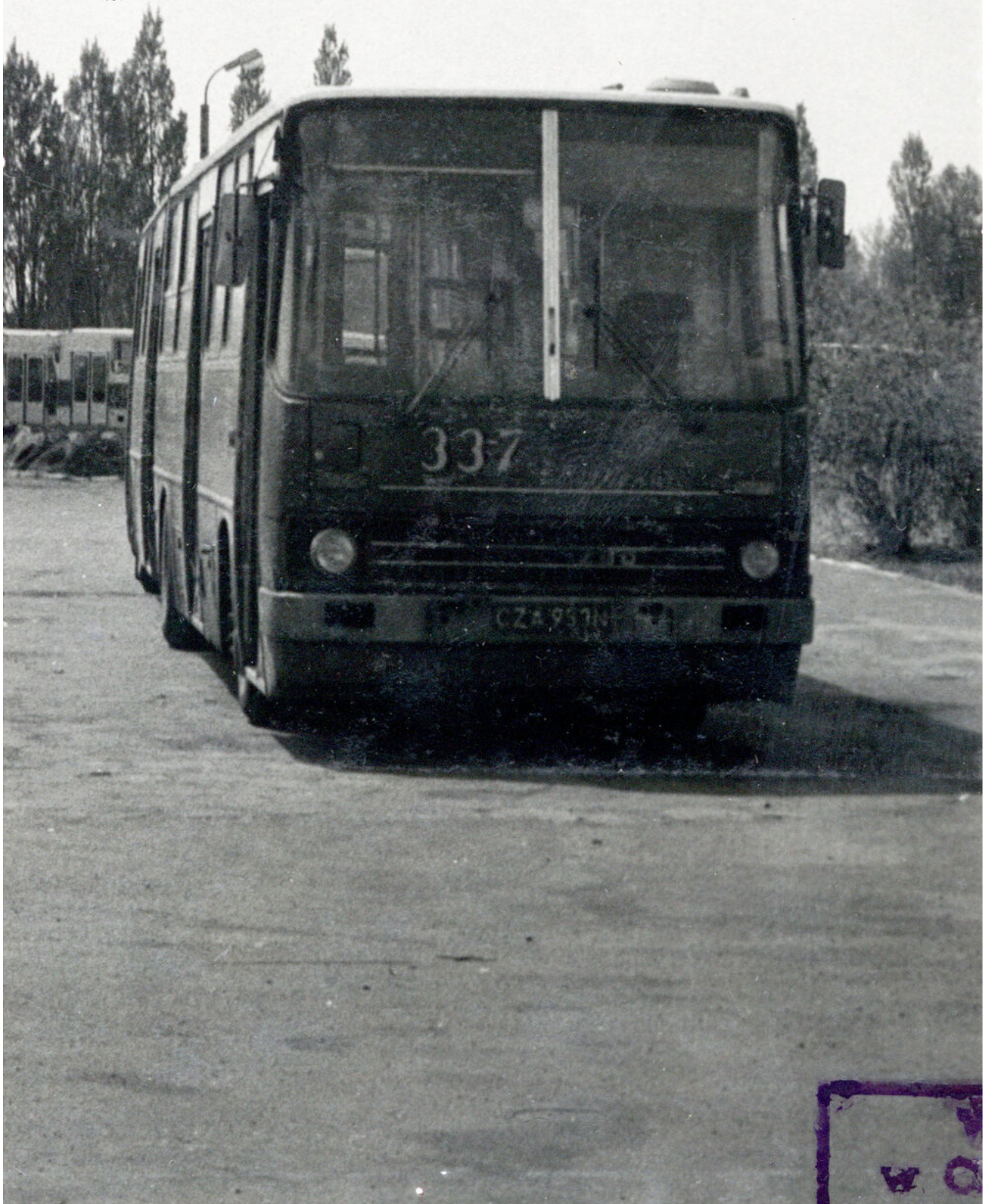
Ikarus" o numerze bocznym 337, jeden z uszkodzonych w zajezdni w Częstochowie, 1988 r. (IPN Ka 09/184, t. 1)