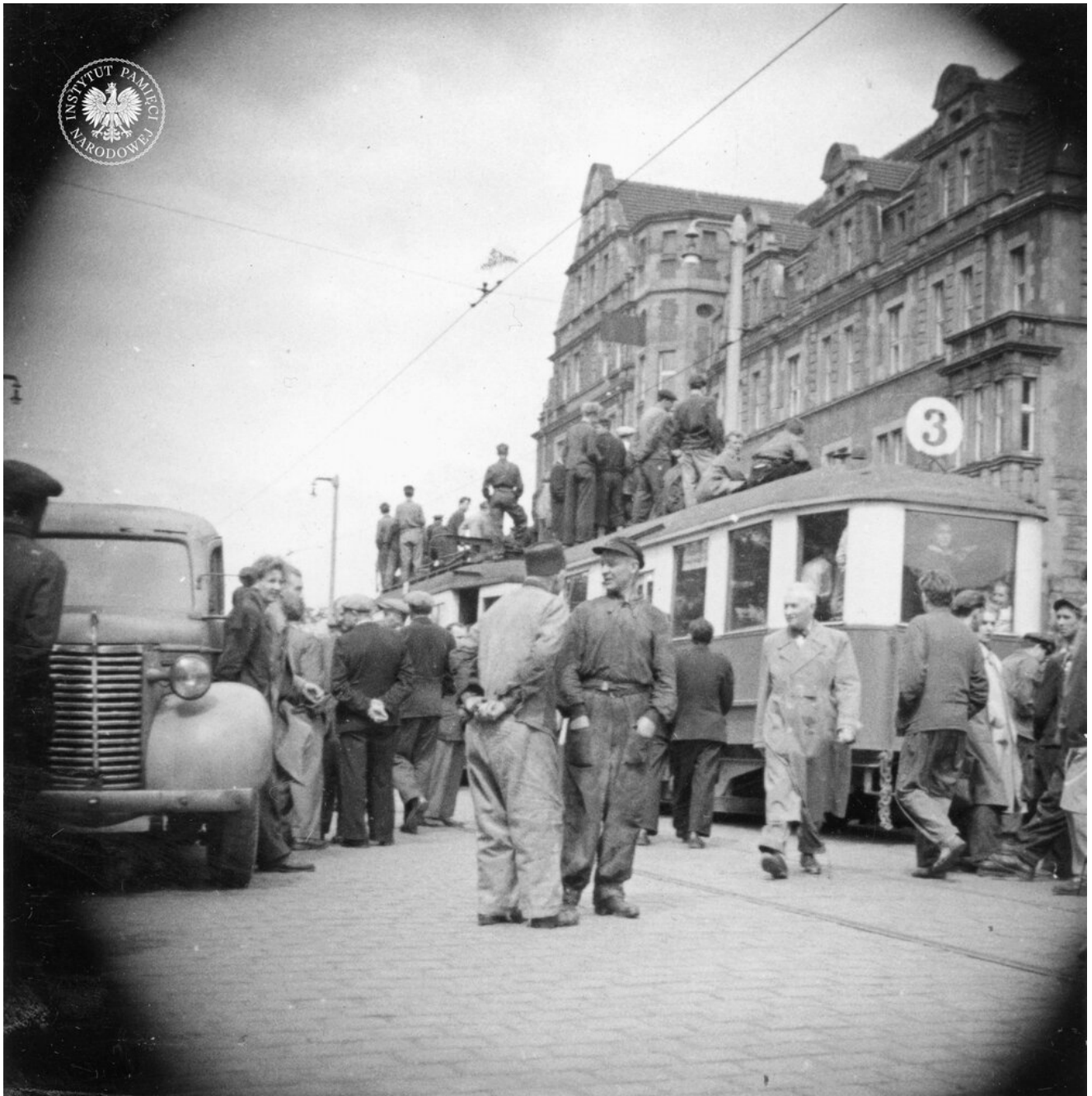
Tramwaj w Poznaniu na ul. Czerwonej Armii (obecnie św. Marcin). Zdjęcie zrobiono podczas protestu w dniu 28 VI 1956 r.