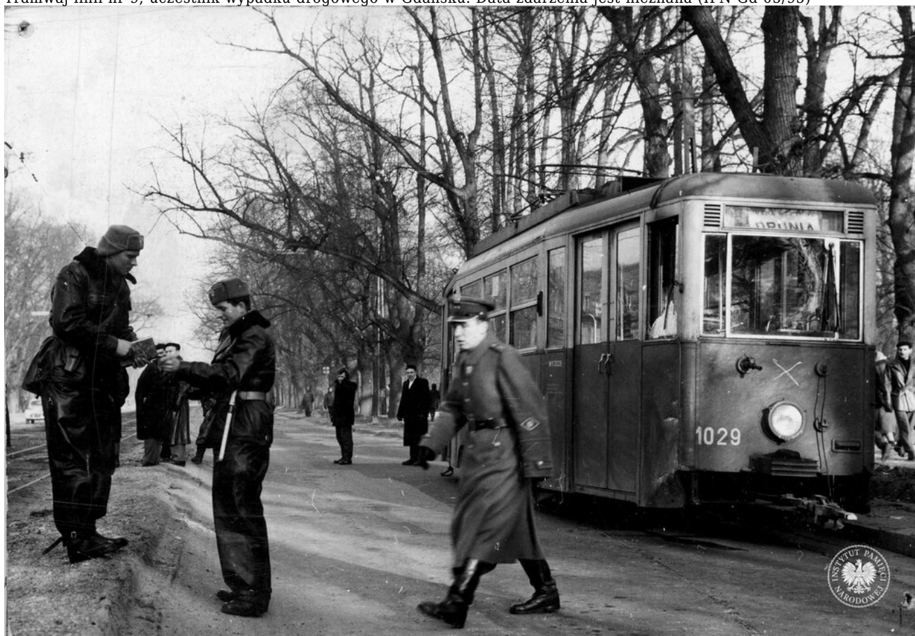
Tramwaj w Gdańsku, data wykonania fotografii jest nieznana (IPN Gd 05/98)