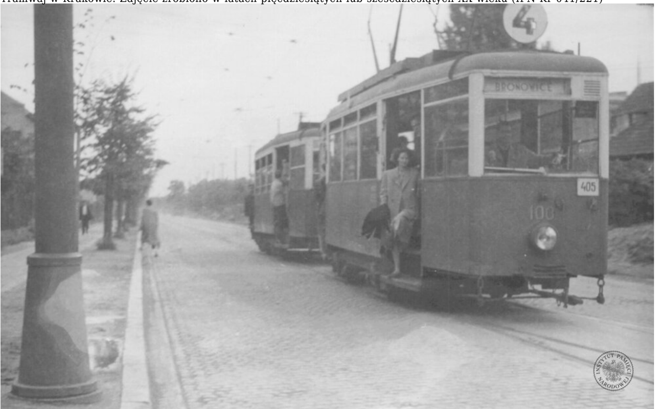
Tramwaj w Krakowie. Zdjęcie zrobiono w latach pięćdziesiątych lub sześćdziesiątych XX wieku (IPN Kr 041/221)