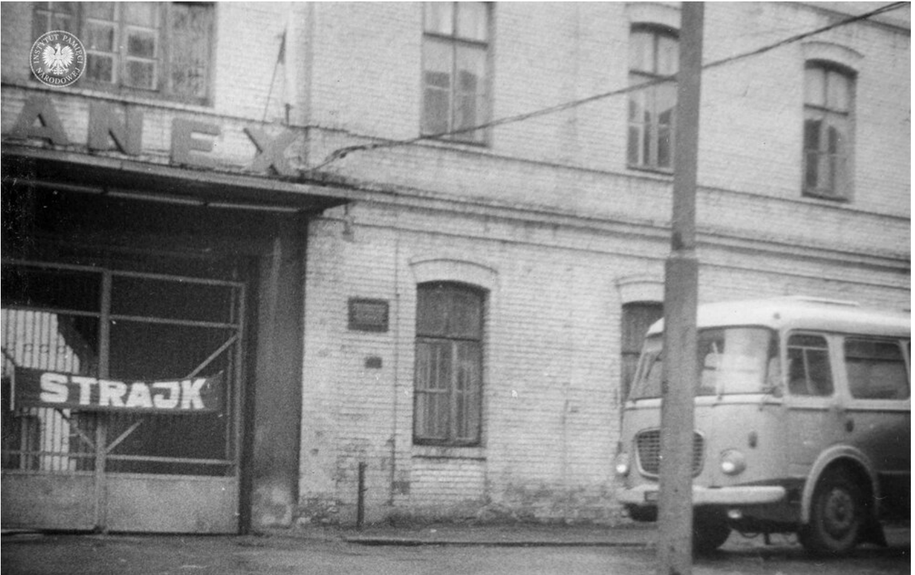
Autobus Jelcz 272 Mex. Zdjęcie wykonano w Częstochowie przy ul. Krakowskiej obok zakładów „Elanex” w marcu 1981 r. (IPN Ka 010/53, t. 8)