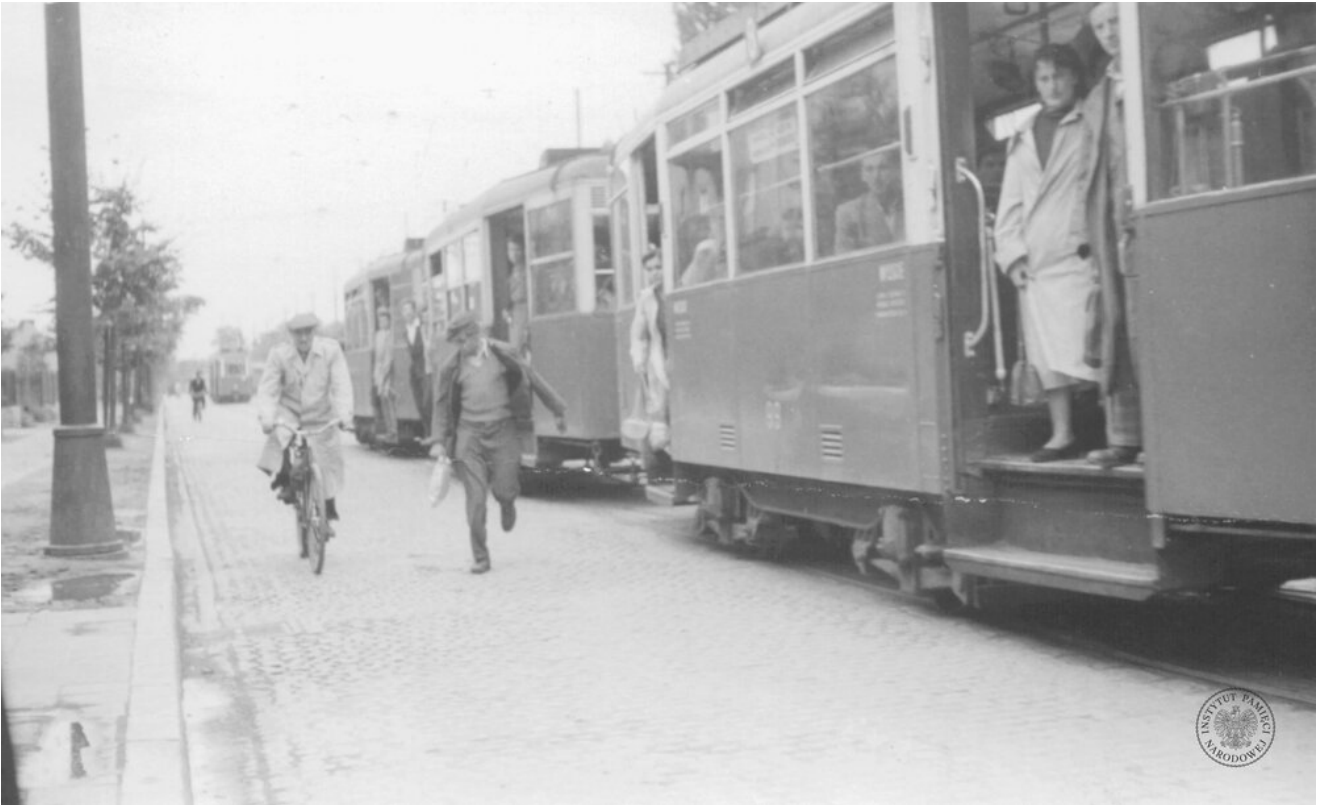
Tramwaj w Krakowie. Zdjęcie zrobiono w latach pięćdziesiątych lub sześćdziesiątych XX wieku (IPN Kr 041/221)