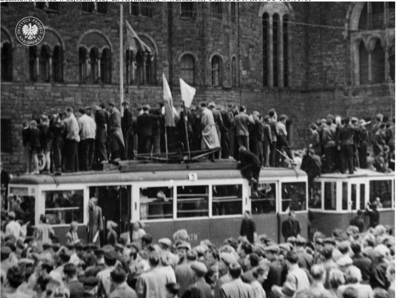
Tramwaj w Poznaniu na ul. Czerwonej Armii (obecnie św. Marcin). Zdjęcie zrobiono podczas protestu w dniu 28 VI 1956 r. (IPN BU 354/2, t. 1)