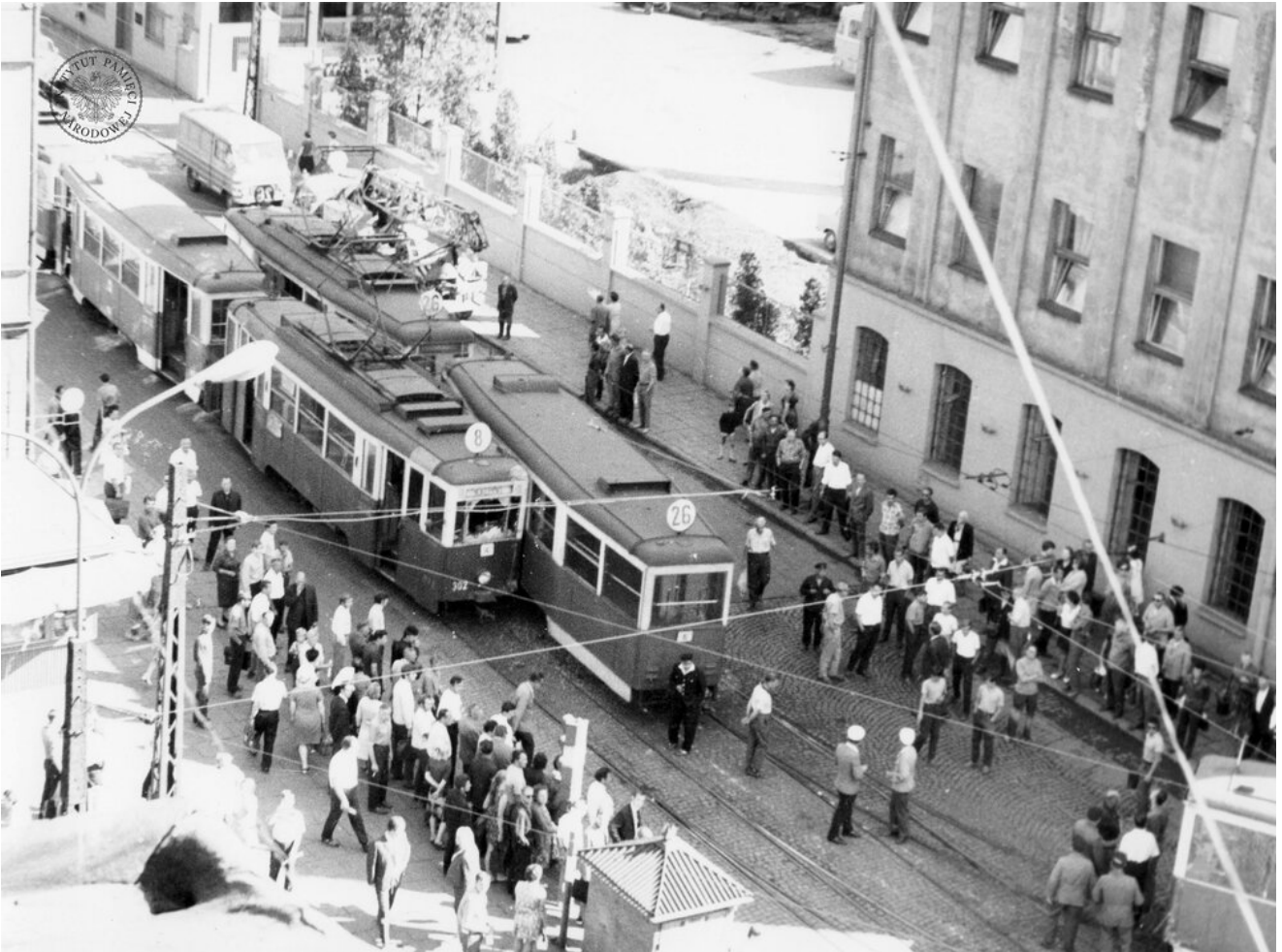
Zderzenie dwóch tramwajów w Łodzi. Data zdarzenia jest nieznana