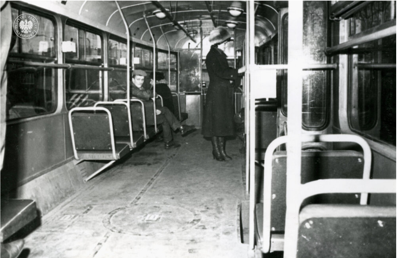
Wnętrze wagonu tramwajowego typu 13N. Fotografię zrobiono podczas wizji lokalnej dot. śmiertelnego postrzelenia Zdzisława Karosa w zajezdni przy ul. Młynarskiej w Warszawie, 4 III 1982 r. (IPN BU 1357/479)