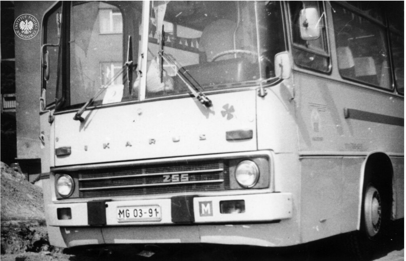
Autobus marki „Ikarus”. Zdjęcie zrobiono prawdopodobnie podczas męskiej pielgrzymki w Piekarach Śląskich, 29 V 1977 r. (IPN Ka 030/121/2)