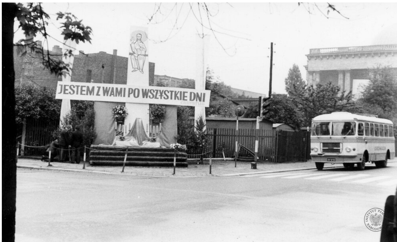
Autobus „San 100” na ul. Wita Stwosza w Katowicach. Zdjęcie zrobiono podczas Bożego Ciała, 17 VI 1976 r. (IPN Ka 085/64, t. 28/1)