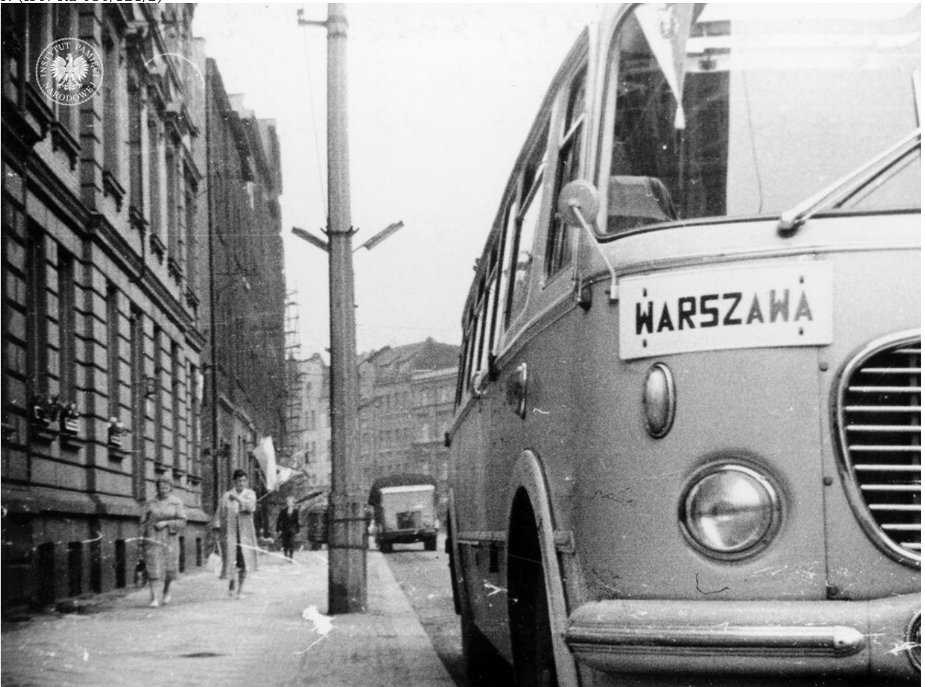
Autokar marki „Jelcz” 043 („Ogórek”) na ul. Warszawskiej w Katowicach. Autobus przyjechał z Warszawy z wycieczką, stąd tabliczka z nazwą miasta. Zdjęcie zrobiono w sierpniu 1964 r.