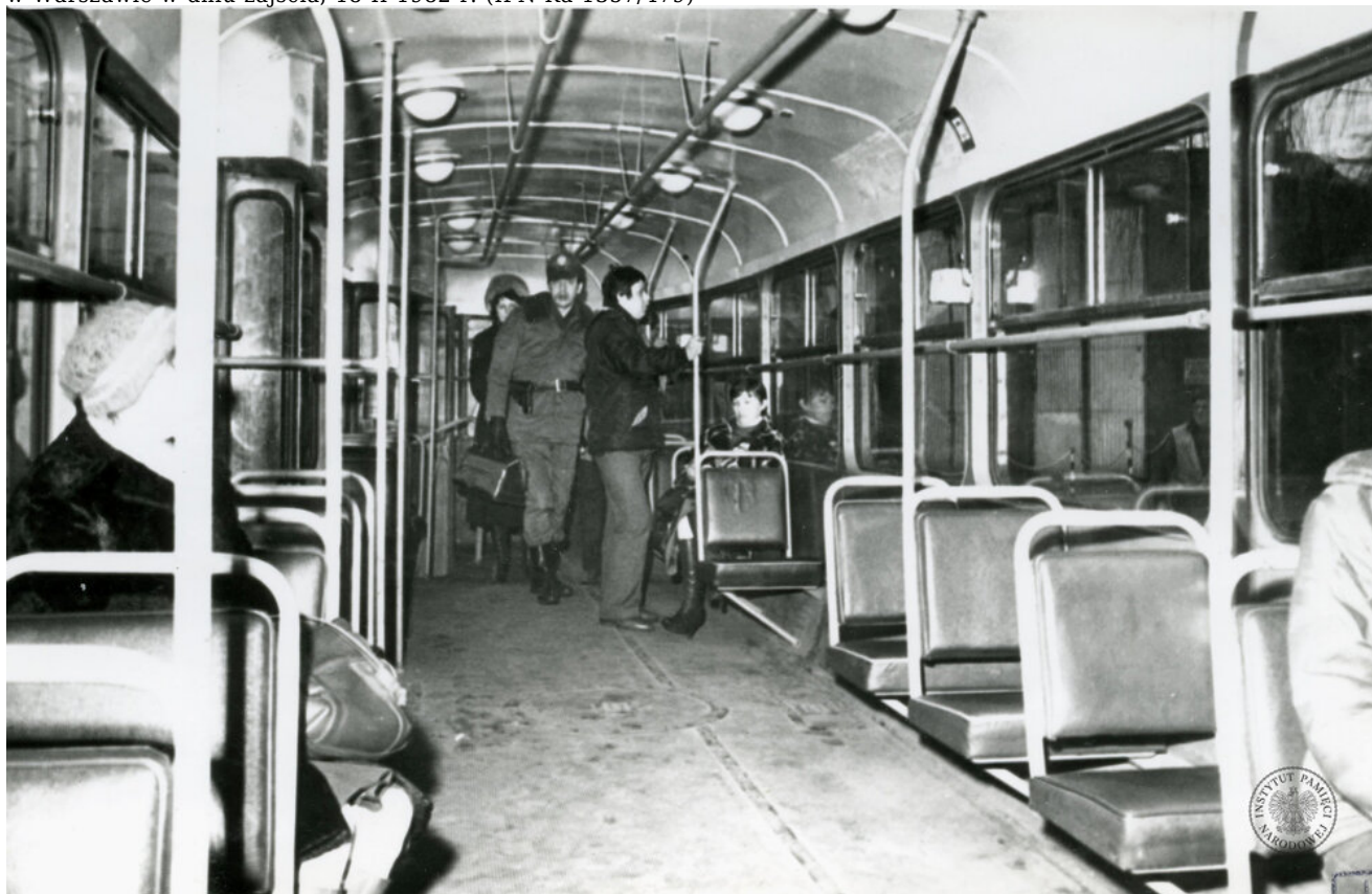
Wnętrze wagonu tramwajowego typu 13N. Fotografię zrobiono podczas wizji lokalnej dot. śmiertelnego postrzelenia Zdzisława Karosa w zajezdni przy ul. Młynarskiej w Warszawie, 4 III 1982 r. (IPN BU 1357/479)