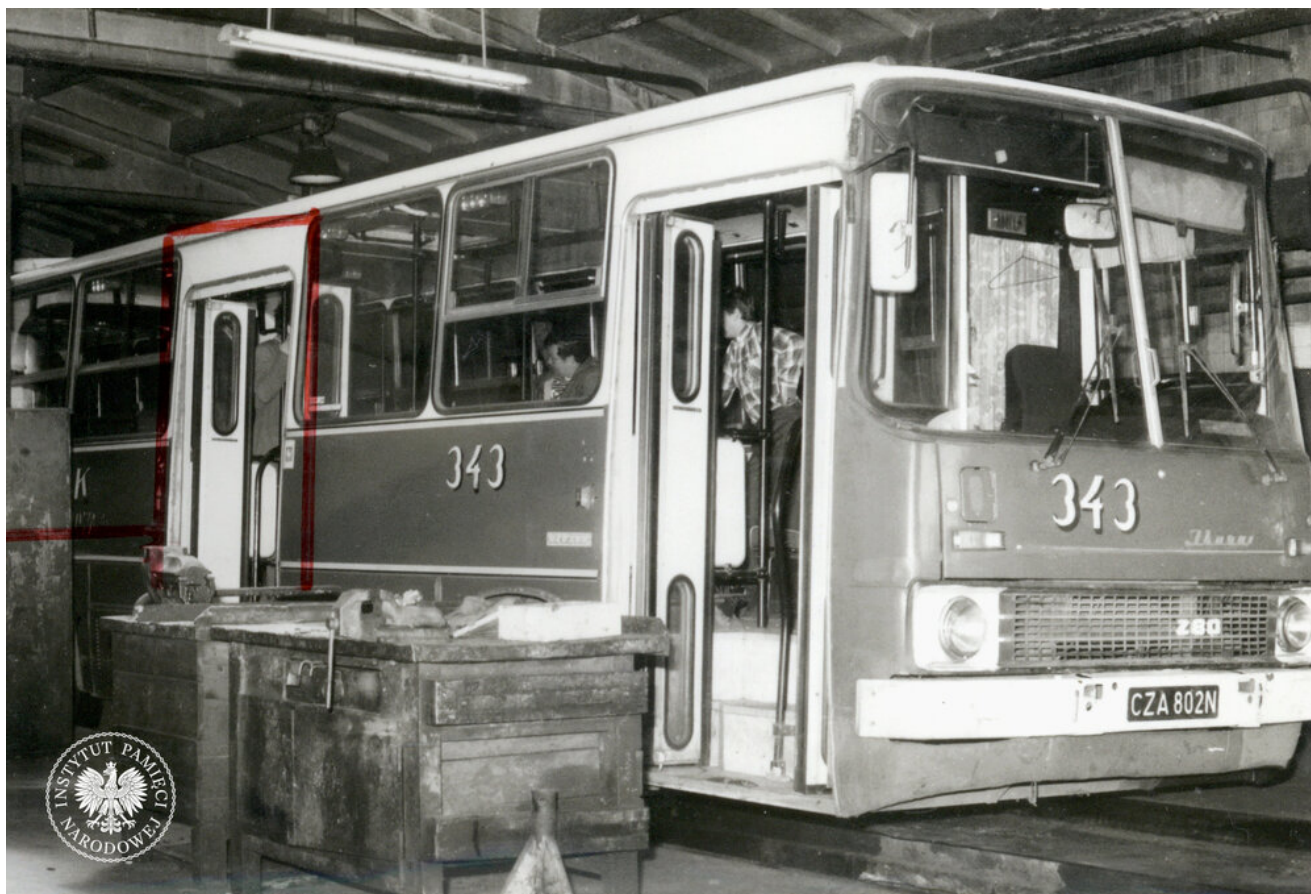
Uszkodzony autobus marki „Ikarus” na kanale naprawczym w zajezdni w Częstochowie, 1988 r.