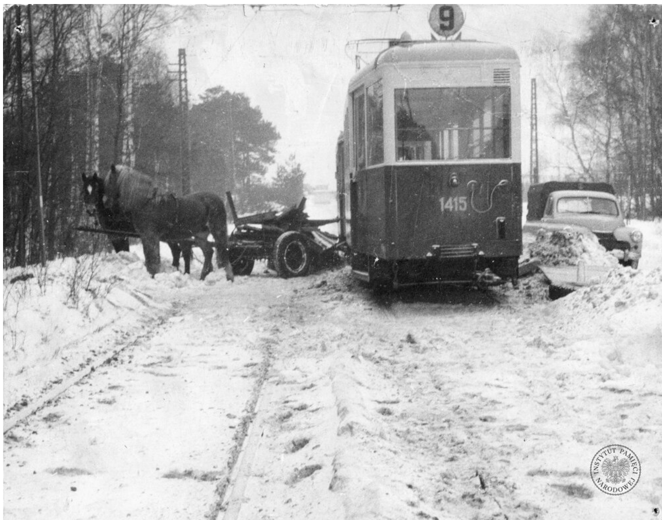
Tramwaj linii nr 9, uczestnik wypadku drogowego w Gdańsku. Data zdarzenia jest nieznana (IPN Gd 05/95)