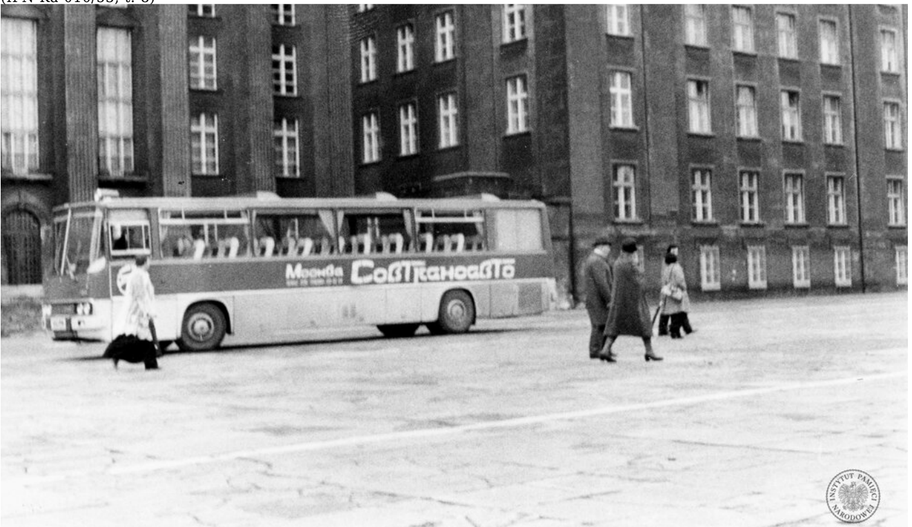
Autobus marki „Ikarus” przed Urzędem Wojewódzkim w Katowicach. Zdjęcie zrobiono podczas Bożego Ciała, 17 VI 1976 r. (IPN Ka 085/64, t. 28/1)