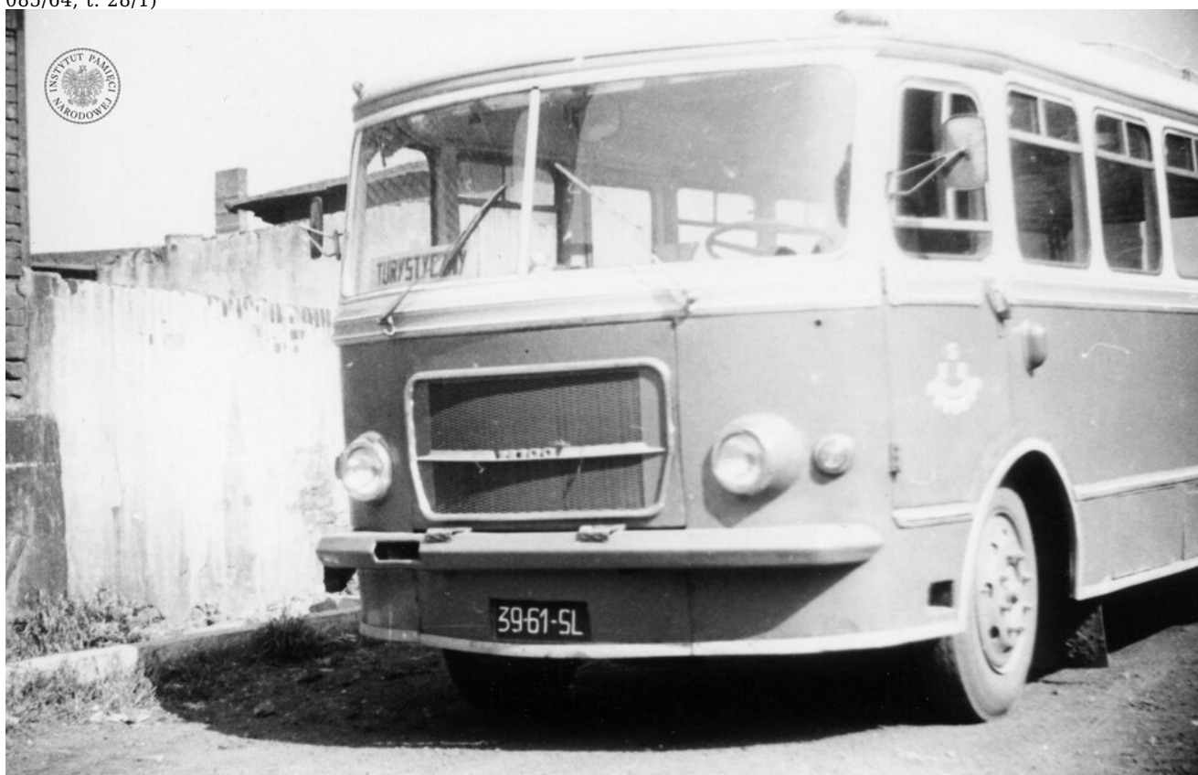
Autobus „San H100”. Zdjęcie zrobiono prawdopodobnie podczas męskiej pielgrzymki w Piekarach Śląskich, 29 V 1977 r. (IPN Ka 030/121/2)