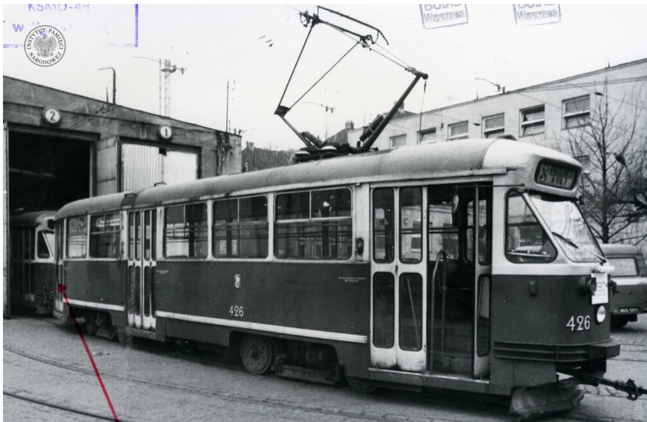
Tramwaj linii nr 24 typu 13N, w którym postrzelono Zdzisława Karosa. Fotografię zrobiono w zajezdni przy ul. Młynarskiej w Warszawie w dniu zajścia, 18 II 1982 r. (IPN Ka 1357/479)