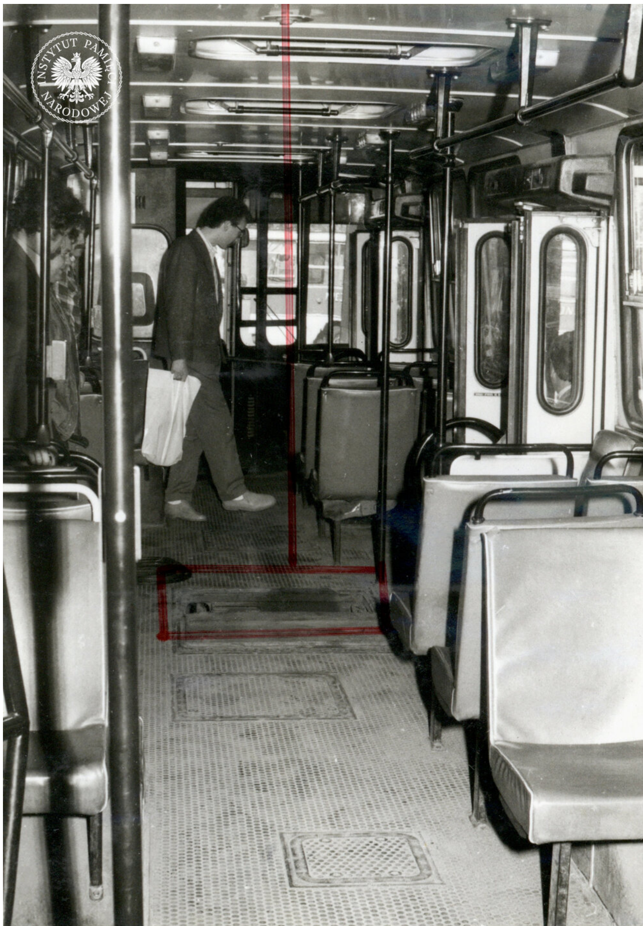
Wnętrze uszkodzonego autobusu z zaznaczoną pokrywą - osłoną sprężarki, 1988 r. (IPN Ka 09/184, t. 1)