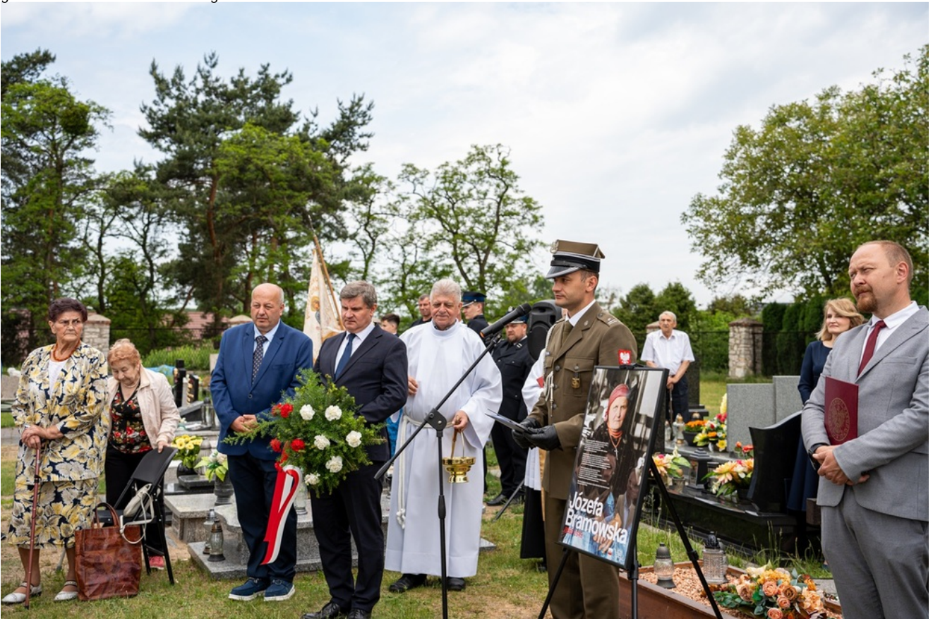
Oznaczenia grobów Józefy i Tomasza Bramowskich znakiem pamięci „Tobie Polsko”. 5. Pułk Chemiczny im. gen. broni Leona Berbeckiego w Tarnowskich Górach