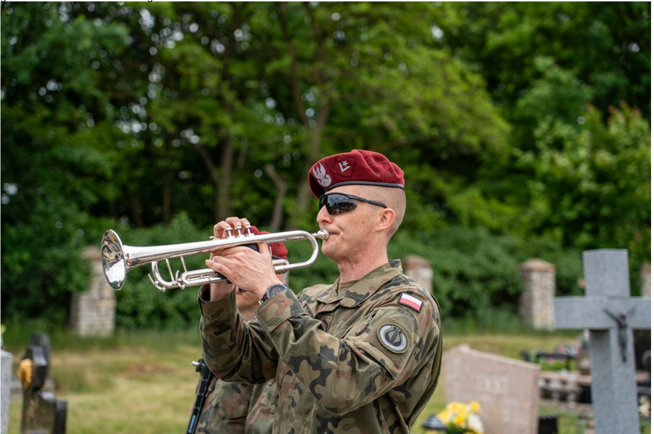
Oznaczenia grobów Józefy i Tomasza Bramowskich znakiem pamięci „Tobie Polsko”. 5. Pułk Chemiczny im. gen. broni Leona Berbeckiego w Tarnowskich Górach