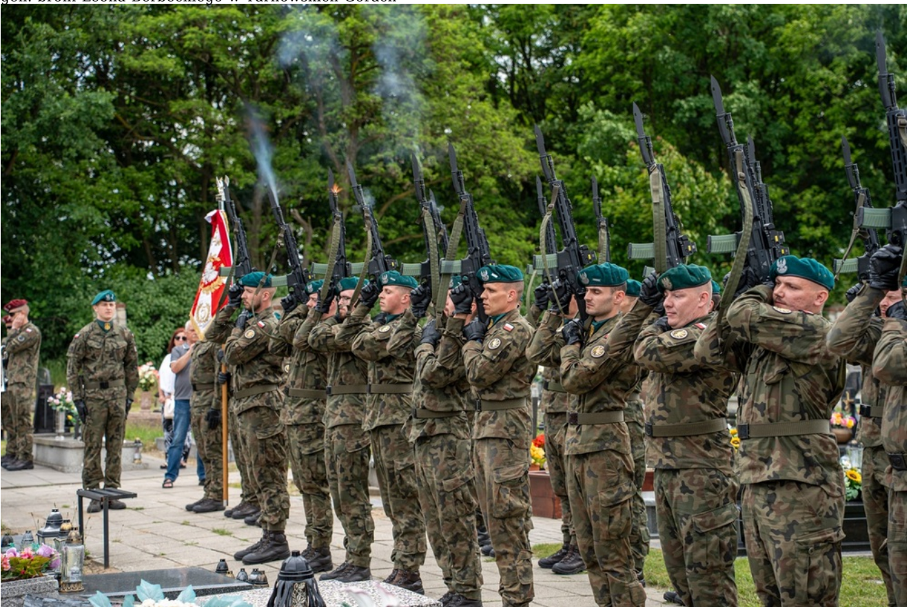
Oznaczenia grobów Józefy i Tomasza Bramowskich znakiem pamięci „Tobie Polsko”. 5. Pułk Chemiczny im. gen. broni Leona Berbeckiego w Tarnowskich Górach