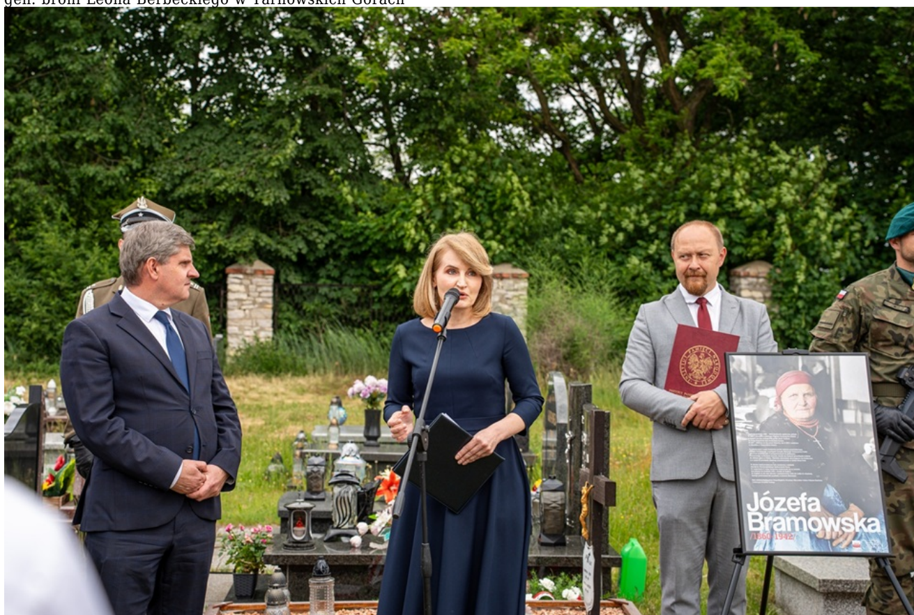
Oznaczenia grobów Józefy i Tomasza Bramowskich znakiem pamięci „Tobie Polsko”. Fot. Kamil Zok 5. Pułk Chemiczny im. gen. broni Leona Berbeckiego w Tarnowskich Górach