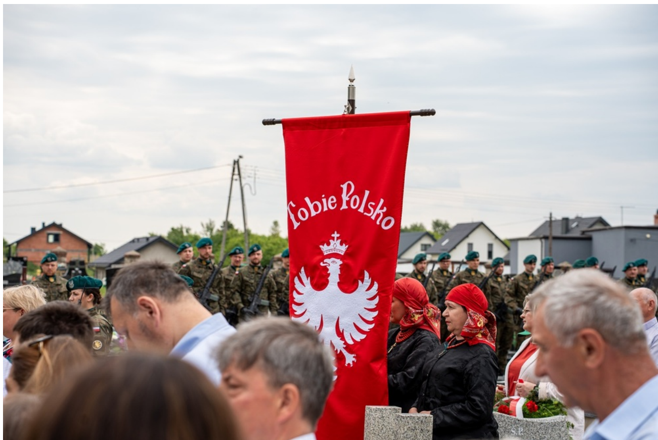
Oznaczenia grobów Józefy i Tomasza Bramowskich znakiem pamięci „Tobie Polsko”. 5. Pułk Chemiczny im. gen. broni Leona Berbeckiego w Tarnowskich Górach