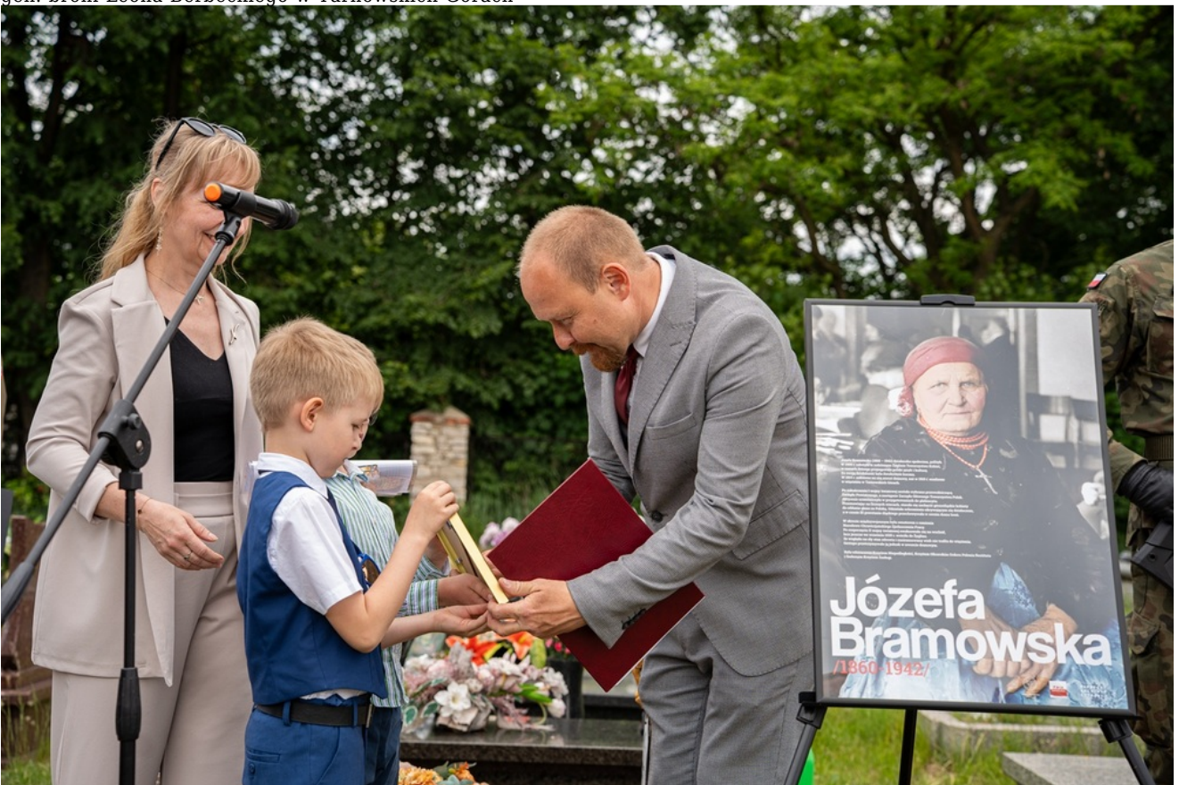
Oznaczenia grobów Józefy i Tomasza Bramowskich znakiem pamięci „Tobie Polsko”. Fot. Kamil Zok 5. Pułk Chemiczny im. gen. broni Leona Berbeckiego w Tarnowskich Górach