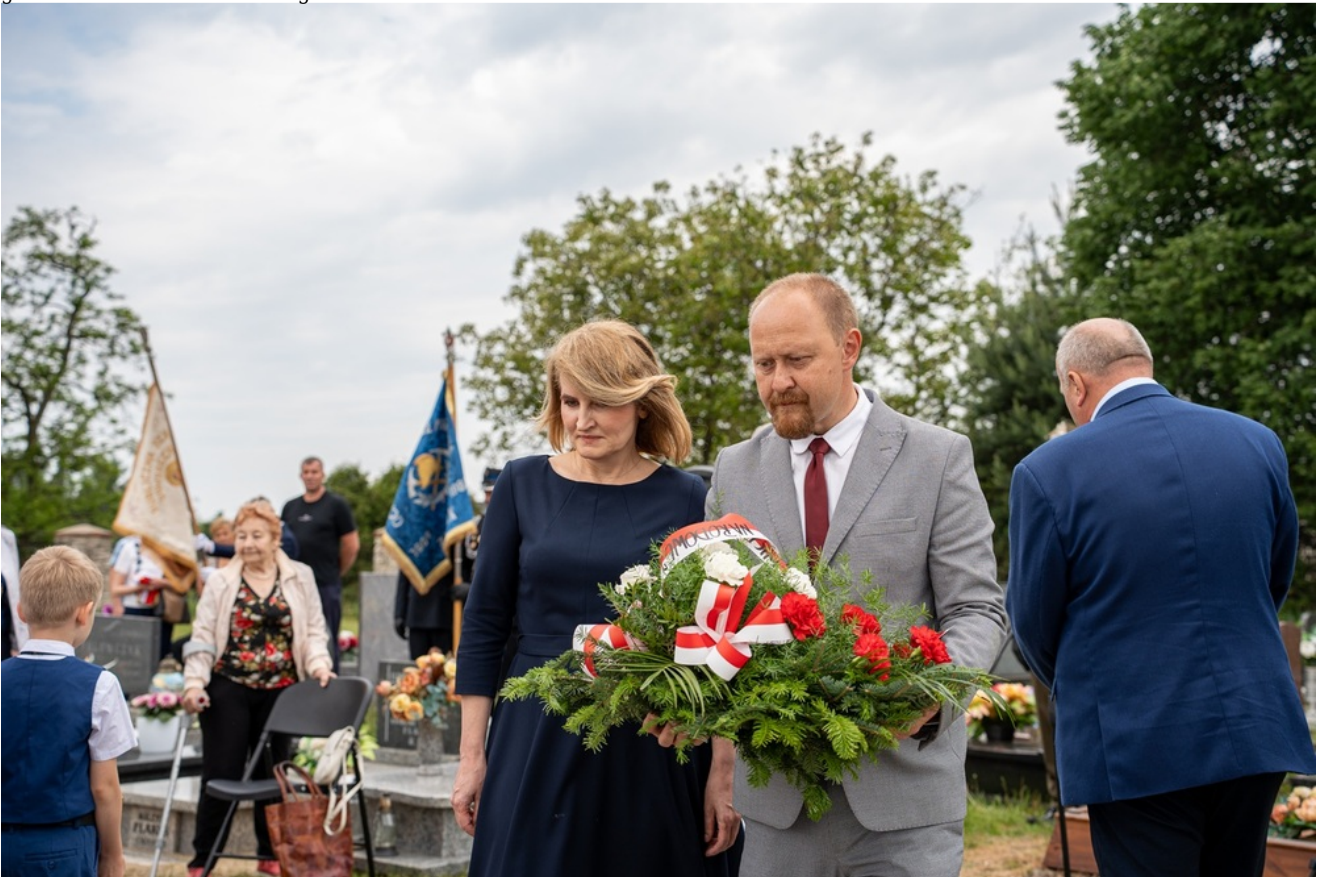
Oznaczenia grobów Józefy i Tomasza Bramowskich znakiem pamięci „Tobie Polsko”. Fot. Kamil Zok 5. Pułk Chemiczny im. gen. broni Leona Berbeckiego w Tarnowskich Górach