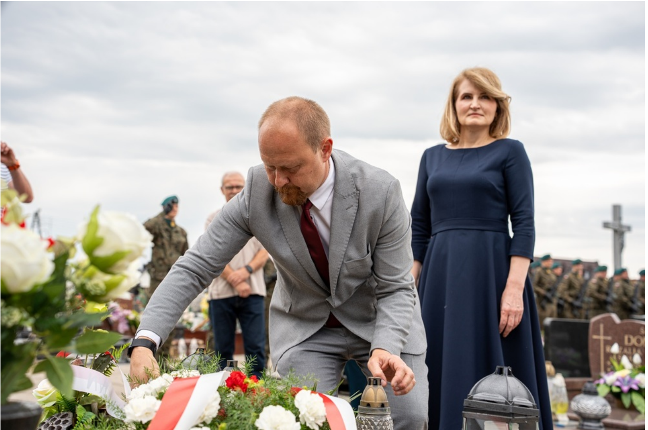
Oznaczenia grobów Józefy i Tomasza Bramowskich znakiem pamięci „Tobie Polsko”. 5. Pułk Chemiczny im. gen. broni Leona Berbeckiego w Tarnowskich Górach