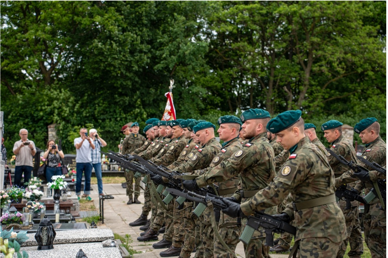
Oznaczenia grobów Józefy i Tomasza Bramowskich znakiem pamięci „Tobie Polsko”. 5. Pułk Chemiczny im. gen. broni Leona Berbeckiego w Tarnowskich Górach