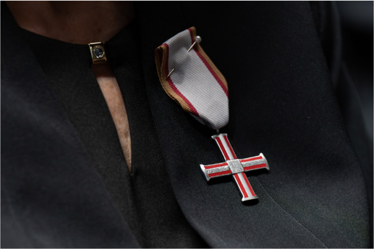
Uroczystość wręczenia Krzyży Wolności i Solidarności - Katowice, 27 października 2025