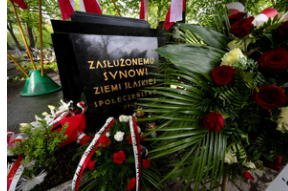
151. rocznica urodzin Wojciecha Korfanteo - Katowice, 20 kwietnia 2024 r.

Wojciech Korfanty (1873–1939) to najważniejszy przedstawiciel polskiego ruchu narodowego z Górnego Śląska. Przeciwstawiał się germanizacyjnej polityce władz niemieckich wobec ludności polskiej, walczył o polepszenie sytuacji niższych warstw społecznych. Występował na forum parlamentarnym i na wiecach, był czynny jako dziennikarz i wydawca prasowy, stworzył gazety „Polak” i „Górnoślązak”. W listopadzie 1918 r. został członkiem Naczelnej Rady Ludowej w Poznaniu, kierował jej wydziałem wojskowym w czasie powstania wielkopolskiego. Gdy w traktacie wersalskim zapisano, że los Górnego Śląska ma zostać rozstrzygnięty w plebiscycie, stanął na czele Polskiego Komisariatu Plebiscytowego i kierował jego akcją propagandową. W maju 1921 r. wywołał III powstanie śląskie i został jego dyktatorem, odnosząc sukcesy militarne i polityczne. Wskutek oporu Józefa Piłsudskiego nie objął stanowiska premiera, pozostał jednak wiodącym politykiem w województwie śląskim. Był jednym z twórców i liderów polskiej chadecji, wydawcą i publicystą dziennika „Polonia”. Po zamachu majowym 1926 r. przeciwstawił się sanacji, za co spotkały go szykany, m.in. uwięzienie w Brześciu. W 1938 r. wyemigrował do Czechosłowacji. Powrócił do Polski w kwietniu 1939 r. i został aresztowany. Zmarł tuż po zwolnieniu z więzienia. Na Górnym Śląsku był legendą już za życia.