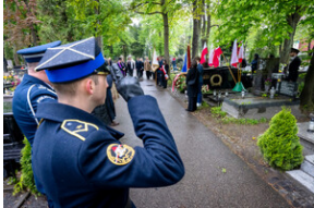
151. rocznica urodzin Wojciecha Korfanteo - Katowice, 20 kwietnia 2024 r.