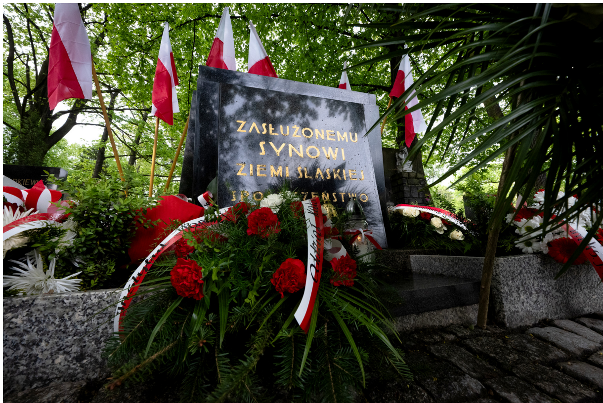
151. rocznica urodzin Wojciecha Korfantego - Katowice, 20 kwietnia 2024 r.

20 kwietnia 2024 r. w Katowicach uczczono 151. rocznicę urodzin Wojciecha Korfantego.