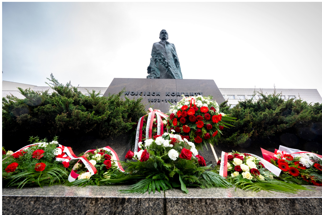
151. rocznica urodzin Wojciecha Korfantego - Katowice, 20 kwietnia 2024 r.