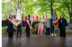
151. rocznica urodzin Wojciecha Korfanteo - Katowice, 20 kwietnia 2024 r.