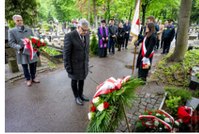
151. rocznica urodzin Wojciecha Korfanteo - Katowice, 20 kwietnia 2024 r.