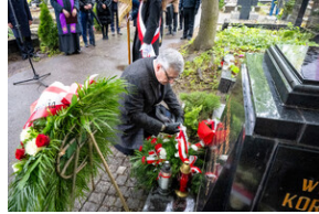
151. rocznica urodzin Wojciecha Korfanteo - Katowice, 20 kwietnia 2024 r.