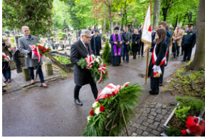
151. rocznica urodzin Wojciecha Korfanteo - Katowice, 20 kwietnia 2024 r.