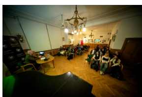
Prelekcja „Odyseja Czarnych Diabłów. Udział 1 Dywizji Pancerniej gen. Stanisława Maczka w walkach na Zachodzie Europy”. - Katowice, 19 kwietnia 2024 r.