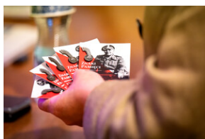
Prelekcja „Odyseja Czarnych Diabłów. Udział 1 Dywizji Pancerniej gen. Stanisława Maczka w walkach na Zachodzie Europy”. - Katowice, 19 kwietnia 2024 r.