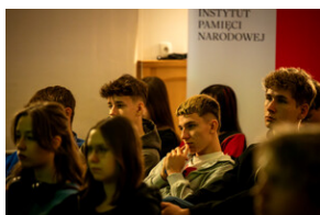
Prelekcja „Odyseja Czarnych Diabłów. Udział 1 Dywizji Pancerniej gen. Stanisława Maczka w walkach na Zachodzie Europy”. - Katowice, 19 kwietnia 2024 r.