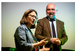
Prelekcja „Odyseja Czarnych Diabłów. Udział 1 Dywizji Pancerniej gen. Stanisława Maczka w walkach na Zachodzie Europy”. - Katowice, 19 kwietnia 2024 r.