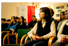
Prelekcja „Odyseja Czarnych Diabłów. Udział 1 Dywizji Pancerniej gen. Stanisława Maczka w walkach na Zachodzie Europy”. - Katowice, 19 kwietnia 2024 r.