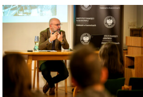
Prelekcja „Odyseja Czarnych Diabłów. Udział 1 Dywizji Pancerniej gen. Stanisława Maczka w walkach na Zachodzie Europy”. - Katowice, 19 kwietnia 2024 r.

W komunistycznej Polsce traktowano tzw. maczkowców jak wrogów narodu, a władza ludowa odebrała gen. Maczkowi polskie obywatelstwo uchwałą Tymczasowego Rządu Jedności Narodowej z 26 września 1946 roku. Komunistyczne władze chciały w ten sposób ukarać oficerów Polskich Sił Zbrojnych na Zachodzie, którzy zdecydowali się nie wracać do Polski po zakończeniu drugiej wojny światowej.