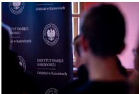
"...ofiary były całkowicie zaskoczone śmiercią". Modus operandi zbrodni katyńskiej a pamięć zbiórowa Polaków. - Tarnowskie Góry, 16 kwietnia 2024 r.