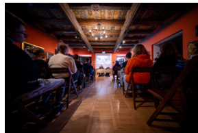
"...ofiary były całkowicie zaskoczone śmiercią". Modus operandi zbrodni katyńskiej a pamięć zbiórowa Polaków. - Tarnowskie Góry, 16 kwietnia 2024 r.