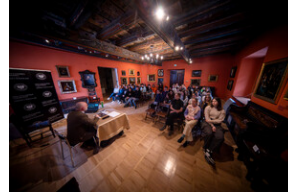
"...ofiary były całkowicie zaskoczone śmiercią". Modus operandi zbrodni katyńskiej a pamięć zbiórowa Polaków. - Tarnowskie Góry, 16 kwietnia 2024 r. - Fot.: IPN K. Łojko