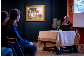
"...ofiary były całkowicie zaskoczone śmiercią". Modus operandi zbrodni katyńskiej a pamięć zbiórowa Polaków. - Tarnowskie Góry, 16 kwietnia 2024 r. - Fot.: IPN K. Łojko