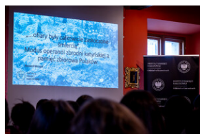
"...ofiary były całkowicie zaskoczone śmiercią". Modus operandi zbrodni katyńskiej a pamięć zbiorowa Polaków. - Tarnowskie Góry, 16 kwietnia 2024 r.