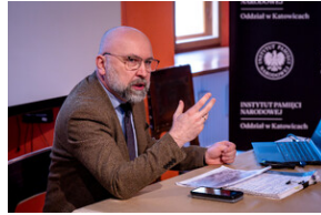
"...ofiary były całkowicie zaskoczone śmiercią". Modus operandi zbrodni katyńskiej a pamięć zbiórowa Polaków. - Tarnowskie Góry, 16 kwietnia 2024 r.