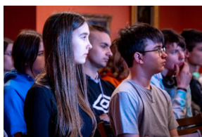
"...ofiary były całkowicie zaskoczone śmiercią". Modus operandi zbrodni katyńskiej a pamięć zbiorowa Polaków. - Tarnowskie Góry, 16 kwietnia 2024 r.