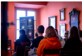
"...ofiary były całkowicie zaskoczone śmiercią". Modus operandi zbrodni katyńskiej a pamięć zbiórowa Polaków. - Tarnowskie Góry, 16 kwietnia 2024 r.