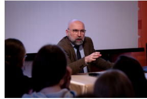
"...ofiary były całkowicie zaskoczone śmiercią". Modus operandi zbrodni katyńskiej a pamięć zbiórowa Polaków. - Tarnowskie Góry, 16 kwietnia 2024 r. - Fot.: IPN K. Łojko