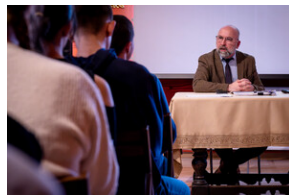
"...ofiary były całkowicie zaskoczone śmiercią". Modus operandi zbrodni katyńskiej a pamięć zbiórowa Polaków. - Tarnowskie Góry, 16 kwietnia 2024 r.