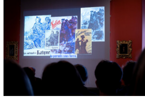
"...ofiary były całkowicie zaskoczone śmiercią". Modus operandi zbrodni katyńskiej a pamięć zbiórowa Polaków. - Tarnowskie Góry, 16 kwietnia 2024 r.