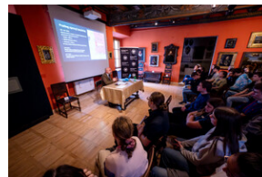
"...ofiary były całkowicie zaskoczone śmiercią". Modus operandi zbrodni katyńskiej a pamięć zbiórowa Polaków. - Tarnowskie Góry, 16 kwietnia 2024 r. - Fot.: IPN K. Łojko