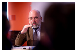
"...ofiary były całkowicie zaskoczone śmiercią". Modus operandi zbrodni katyńskiej a pamięć zbiorowa Polaków. - Tarnowskie Góry, 16 kwietnia 2024 r.

Zbrodnia katyńska stała się symbolem komunistycznych zbrodni dokonanych na Polakach przez krwawy system polityczny Stalina. Odkrycie przez Niemców masowych grobów w czasie II wojny światowej zostało wykorzystane w 1943 roku przez propagandę III Rzeszy. Błyskawiczna reakcja propagandy sowieckiej i powojenna budowa tzw. kłamstwa katyńskiego nie pozwalała polskiemu społeczeństwu przez wiele lat na poznanie prawdy o losach jeńców zamordowanych w 1940 roku m.in. w Katyniu, Smoleńsku, Twerze i Charkowie. Spotkanie będzie okazją do poznania rzeczywistego obrazu tej zbrodni w świetle współczesnej wiedzy na temat mechaniki terroru komunistycznego w Rosji Sowieckiej.