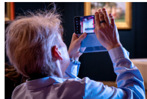
"...ofiary były całkowicie zaskoczone śmiercią". Modus operandi zbrodni katyńskiej a pamięć zbiórowa Polaków. - Tarnowskie Góry, 16 kwietnia 2024 r. - Fot.: IPN K. Łojko