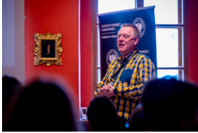
"...ofiary były całkowicie zaskoczone śmiercią". Modus operandi zbrodni katyńskiej a pamięć zbiórowa Polaków. - Tarnowskie Góry, 16 kwietnia 2024 r. - Fot.: IPN K. Łojko