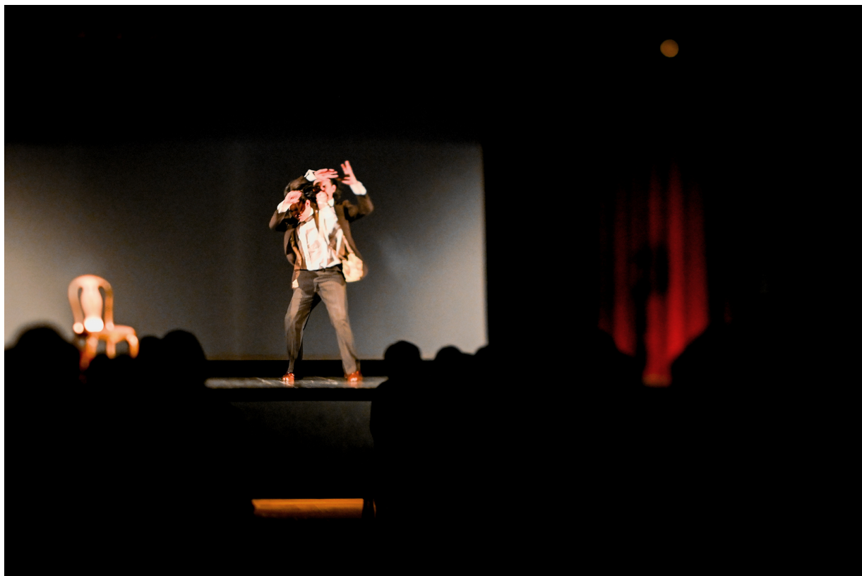
„Zupa rybna w Odessie” monodram o Janie Karskim - Bielsko-Biała, 22 kwietnia 2024.