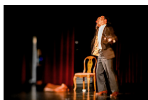
„Zupa rybna w Odessie” monodram o Janie Karskim – Bielsko-