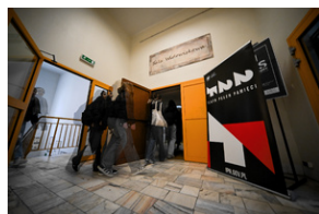
„Zupa rybna w Odessie” monodram o Janie Karskim – Bielsko-Biała, 22 kwietnia 2024.

Patroni medialni: TVP3 Katowice, „Dziennik Zachodni” oraz naszemiasto.pl