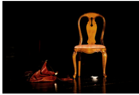
„Zupa rybna w Odessie” monodram o Janie Karskim – Bielsko-Biała, 22 kwietnia 2024.