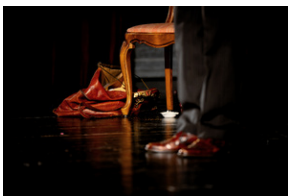
„Zupa rybna w Odessie” monodram o Janie Karskim – Bielsko-Biała, 22 kwietnia 2024.