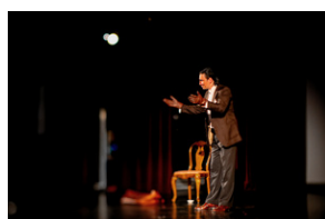
„Zupa rybna w Odessie” monodram o Janie Karskim – Bielsko-