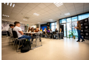
Zajęcia edukacyjne „Polskie drogi do niepodległości”.