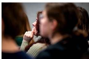
Zajęcia edukacyjne „Puść mnie Matko do powstania. Powstania śląskie 1919-1921”.

14 marca Przystanek Historia gościł natomiast uczniów szkoły podstawowej z Lublińca,