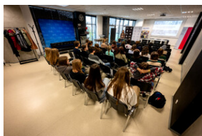
Zajęcia edukacyjne „Puść mnie Matko do powstania. Powstania śląskie 1919-1921”.