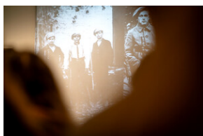
Zajęcia edukacyjne „Puść mnie Matko do powstania. Powstania śląskie 1919-1921”.