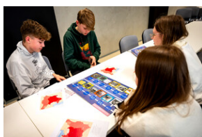
Zajęcia edukacyjne „Polskie drogi do niepodległości”.