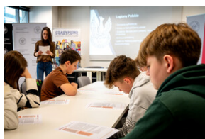
Zajęcia edukacyjne „Polskie drogi do niepodległości”.