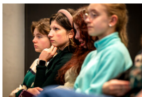
Zajęcia edukacyjne „Puść mnie Matko do powstania. Powstania śląskie 1919-1921”.