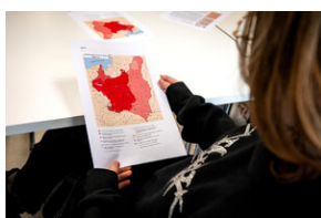
Zajęcia edukacyjne „Polskie drogi do niepodległości”.