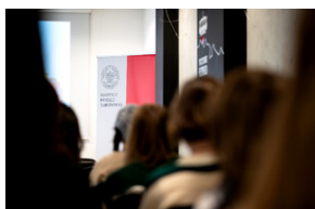
Zajęcia edukacyjne „Puść mnie Matko do powstania. Powstania śląskie 1919-1921”.