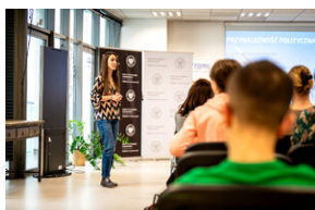
Zajęcia edukacyjne „Puść mnie Matko do powstania. Powstania śląskie 1919-1921”.