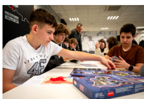
Zajęcia edukacyjne „Polskie drogi do niepodległości”.