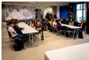
Zajęcia edukacyjne „Polskie drogi do niepodległości”.