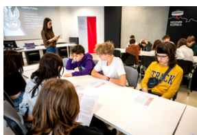
Zajęcia edukacyjne „Polskie drogi do niepodległości”.