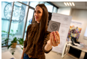
Zajęcia edukacyjne „Polskie drogi do niepodległości”.

którzy wzięli udział w zajęciach edukacyjnych „Polskie drogi do niepodległości”. Zajęcia prowadziła dr Angelika Blinda. W ich trakcie młodzież zapoznała się z wysiłkiem zbrojnym i działalnością dyplomatyczną Polaków w czasie I wojny światowej, sylwetkami Ojców Niepodległości oraz procesem kształtowania się państwa polskiego. Na zakończenie, w ramach podsumowania, młodzież pracowała z grą edukacyjną „Twórcy niepodległości”.