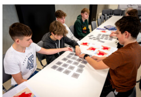
Zajęcia edukacyjne „Polskie drogi do niepodległości”.