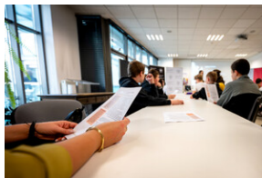
Zajęcia edukacyjne „Polskie drogi do niepodległości”.