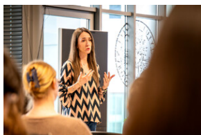
Zajęcia edukacyjne „Puść mnie Matko do powstania. Powstania śląskie 1919-1921”.