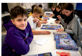
Zajęcia edukacyjne „Polskie drogi do niepodległości”.