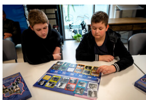
Zajęcia edukacyjne „Polskie drogi do niepodległości”.