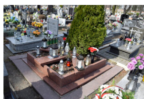
IPN Katowice oddał hołd śp. mjr. Czesławowi Blicharskiemu w 9. rocznicę jego śmierci – Zabrze-Biskupice, 21 marca 2024