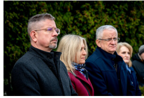
Oddanie hołdu Bohaterom spoczywającym w Kwaterze Żołnierzy Nieznomych - Katowice, 1 marca 2024.