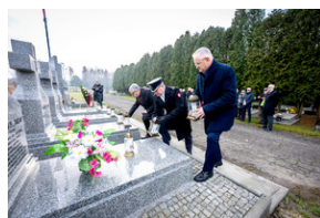
Oddanie hołdu Bohaterom spoczywającym w Kwaterze Żołnierzy