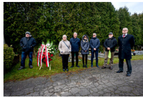
Oddanie hołdu Bohaterom spoczywającym w Kwaterze Żołnierzy Nieznomych - Katowice, 1 marca 2024.