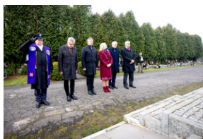
Oddanie hołdu Bohaterom spoczywającym w Kwaterze Żołnierzy Nieznomych - Katowice, 1 marca 2024.