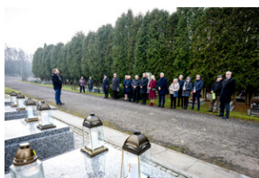
Oddanie hołdu Bohaterom spoczywającym w Kwaterze Żołnierzy