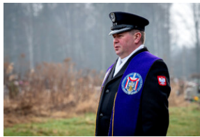
Oddanie hołdu Bohaterom spoczywającym w Kwaterze Żołnierzy Nieznomych - Katowice, 1 marca 2024.