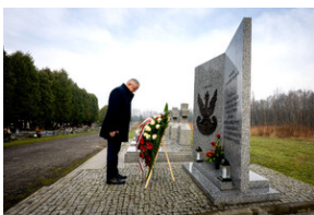
Oddanie hołdu Bohaterom spoczywającym w Kwaterze Żołnierzy Nieznomych - Katowice, 1 marca 2024.