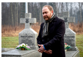
Oddanie hołdu Bohaterom spoczywającym w Kwaterze Żołnierzy