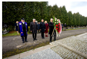
Oddanie hołdu Bohaterom spoczywającym w Kwaterze Żołnierzy Nieznomych - Katowice, 1 marca 2024.