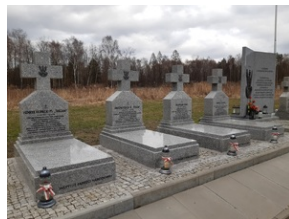
Grobby Niezłomnych (3)