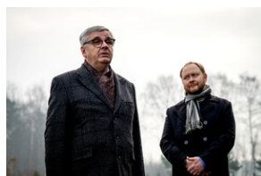
Oddanie hołdu Bohaterom spoczywającym w Kwaterze Żołnierzy