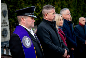
Oddanie hołdu Bohaterom spoczywającym w Kwaterze Żołnierzy Nieznomych - Katowice, 1 marca 2024.