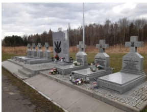
Grobby Niezłomnych (2)