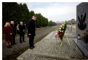
Oddanie hołdu Bohaterom spoczywającym w Kwaterze Żołnierzy Nieznomych - Katowice, 1 marca 2024.