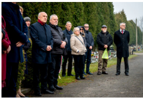
Oddanie hołdu Bohaterom spoczywającym w Kwaterze Żołnierzy Nieznomych - Katowice, 1 marca 2024.