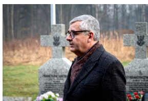
Oddanie hołdu Bohaterom spoczywającym w Kwaterze Żołnierzy