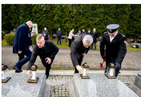
Oddanie hołdu Bohaterom spoczywającym w Kwaterze Żołnierzy