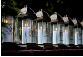
Oddanie hołdu Bohaterom spoczywającym w Kwaterze Żołnierzy Nieznomych - Katowice, 1 marca 2024.