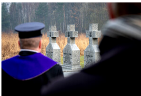
Oddanie hołdu Bohaterom spoczywającym w Kwaterze Żołnierzy Nieznomych - Katowice, 1 marca 2024.