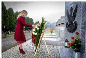
Oddanie hołdu Bohaterom spoczywającym w Kwaterze Żołnierzy Nieznomych - Katowice, 1 marca 2024.