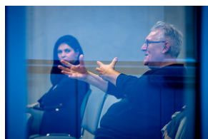
Promocja książki Czas przełomu... – Katowice, 29 lutego 2024.