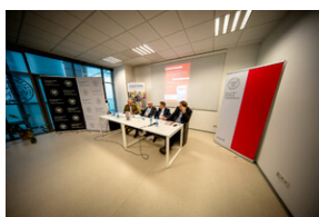
Promocja książki Czas przełomu... – Katowice, 29 lutego 2024.