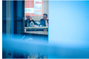
Promocja książki Czas przełomu... – Katowice, 29 lutego 2024.