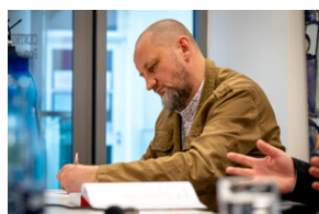
Promocja książki Czas przełomu... – Katowice, 29 lutego 2024.