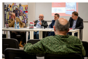
Promocja książki Czas przełomu... – Katowice, 29 lutego 2024.