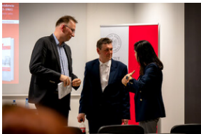
Promocja książki Czas przełomu... – Katowice, 29 lutego 2024.