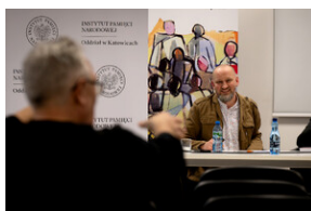
Promocja książki Czas przełomu... – Katowice, 29 lutego 2024.