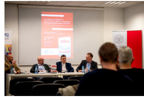
Promocja książki Czas przełomu... – Katowice, 29 lutego 2024.