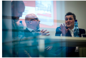
Promocja książki Czas przełomu... – Katowice, 29 lutego 2024.