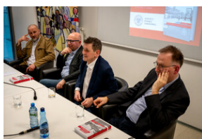
Promocja książki Czas przełomu... – Katowice, 29 lutego 2024.