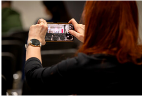
Promocja książki Czas przełomu... – Katowice, 29 lutego 2024.