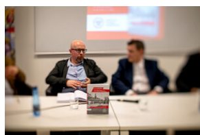
Promocja książki Czas przełomu... – Katowice, 29 lutego 2024.