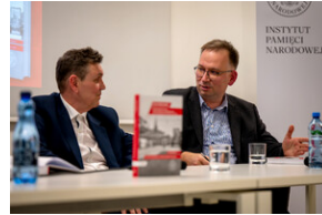
Promocja książki Czas przełomu... – Katowice, 29 lutego 2024.