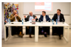
Promocja książki Czas przełomu... – Katowice, 29 lutego 2024.