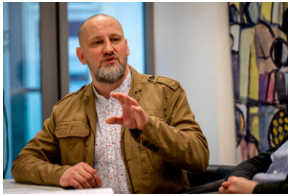
Promocja książki Czas przełomu... – Katowice, 29 lutego 2024.