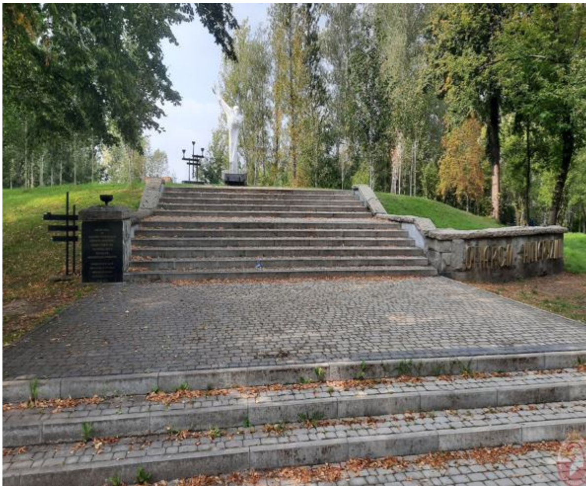
Książenice: Grób zbiorowy wojenny 45 więźniów, którzy zginęli w styczniu 1945 roku w czasie Marszu Śmierci. Nr 10/05 w Ewidencji Miejsc Pamięci Województwa Śląskiego. Książenice, cmentarz parafialny przy ul. ks. J. Pojdy (GPS: 50°09'04.9"N 18°35'43.8"E)