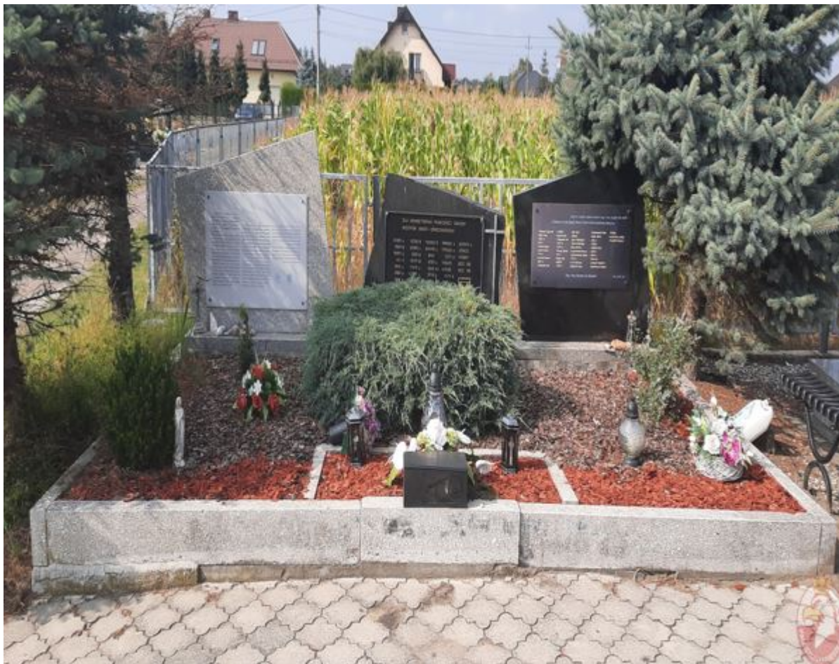
Rybnik: Grób zbiorowy wojenny 446 więźniów KL Auschwitz zamordowanych w czasie Marszu Śmierci . Nr 33/23 w Ewidencji Miejsc Pamięci Województwa Śląskiego. Rybnik, las za parkingiem dodatkowym kąpieliska Ruda (GPS: 50° 6' 53.35" N, 18° 32' 59.25" E)