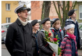
Uroczystość upamiętniająca Marsz Śmierci, ewakuację KL Auschwitz-Birkenau.