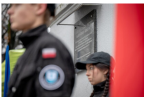
Uroczystość upamiętniająca Marsz Śmierci, ewakuację KL Auschwitz-Birkenau.