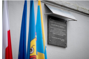
Uroczystość upamiętniająca Marsz Śmierci, ewakuację KL Auschwitz-Birkenau.