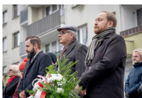
Uroczystość upamiętniająca Marsz Śmierci, ewakuację KL Auschwitz-Birkenau.