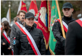
Uroczystość upamiętniająca Marsz Śmierci, ewakuację KL Auschwitz-Birkenau.