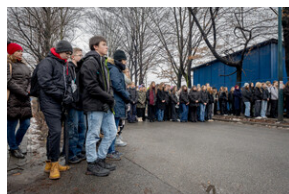
Uroczystość upamiętniająca Marsz Śmierci, ewakuację KL Auschwitz-Birkenau.