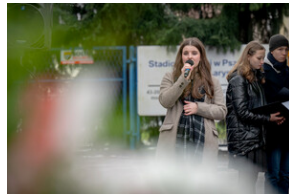
Uroczystość upamiętniająca Marsz Śmierci, ewakuację KL Auschwitz-Birkenau.