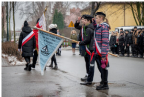
Uroczystość upamiętniająca Marsz Śmierci, ewakuację KL Auschwitz-Birkenau.