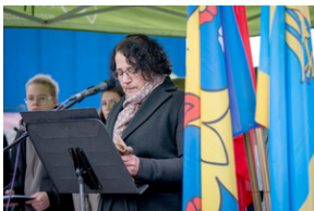
Uroczystość upamiętniająca Marsz Śmierci, ewakuację KL Auschwitz-Birkenau.