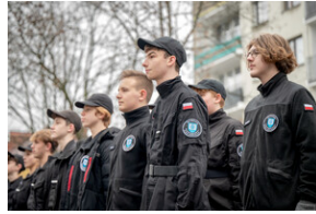
Uroczystość upamiętniająca Marsz Śmierci, ewakuację KL Auschwitz-Birkenau.