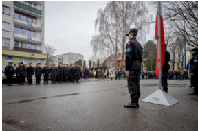
Uroczystość upamiętniająca Marsz Śmierci, ewakuację KL Auschwitz-Birkenau.