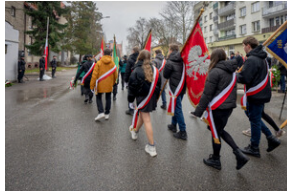
Uroczystość upamiętniająca Marsz Śmierci, ewakuację KL Auschwitz-Birkenau.