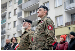
Uroczystość upamiętniająca Marsz Śmierci, ewakuację KL Auschwitz-Birkenau.