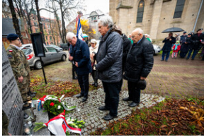
105. rocznica bohaterskiej obrony Lwowa – Katowice, 19 listopada 2023.