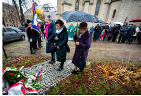
105. rocznica bohaterskiej obrony Lwowa – Katowice, 19 listopada 2023.