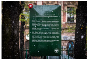
105. rocznica bohaterskiej obrony Lwowa – Katowice, 19 listopada 2023.

Wydarzenie zostało zorganizowane przez Towarzystwo Miłośników Lwowa i Kresów Południowo-Wschodnich Oddział Katowice, parafię Niepokalanego Poczęcia NMP w Katowicach oraz Oddział Instytutu Pamięci Narodowej w Katowicach, który to ufundował tablice.