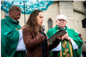
105. rocznica bohaterskiej obrony Lwowa – Katowice, 19 listopada 2023.