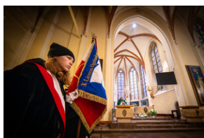
105. rocznica bohaterskiej obrony Lwowa - Katowice, 19 listopada 2023.