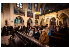
105. rocznica bohaterskiej obrony Lwowa - Katowice, 19 listopada 2023.