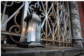
105. rocznica bohaterskiej obrony Lwowa – Katowice, 19 listopada 2023.