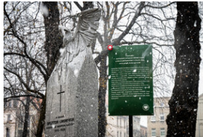
105. rocznica bohaterskiej obrony Lwowa – Katowice, 19 listopada 2023.