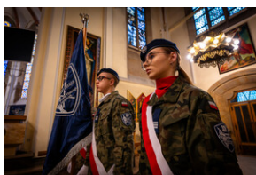
105. rocznica bohaterskiej obrony Lwowa - Katowice, 19 listopada 2023.