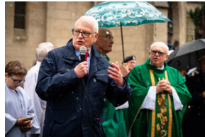
105. rocznica bohaterskiej obrony Lwowa – Katowice, 19 listopada 2023.