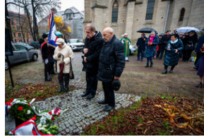
105. rocznica bohaterskiej obrony Lwowa – Katowice, 19 listopada 2023.