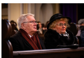
105. rocznica bohaterskiej obrony Lwowa - Katowice, 19 listopada 2023. Fot.: IPN K. Łojko