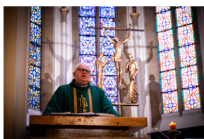
105. rocznica bohaterskiej obrony Lwowa - Katowice, 19 listopada 2023.