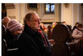
105. rocznica bohaterskiej obrony Lwowa - Katowice, 19 listopada 2023.