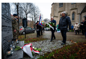
105. rocznica bohaterskiej obrony Lwowa - Katowice, 19 listopada 2023.