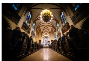
105. rocznica bohaterskiej obrony Lwowa - Katowice, 19 listopada 2023.