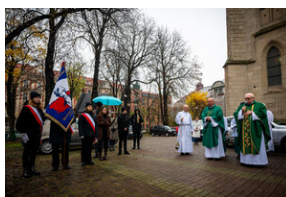
105. rocznica bohaterskiej obrony Lwowa - Katowice, 19 listopada 2023.