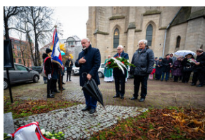
105. rocznica bohaterskiej obrony Lwowa - Katowice, 19 listopada 2023.