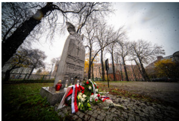
105. rocznica bohaterskiej obrony Lwowa – Katowice, 19 listopada 2023.