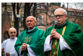
105. rocznica bohaterskiej obrony Lwowa - Katowice, 19 listopada 2023.