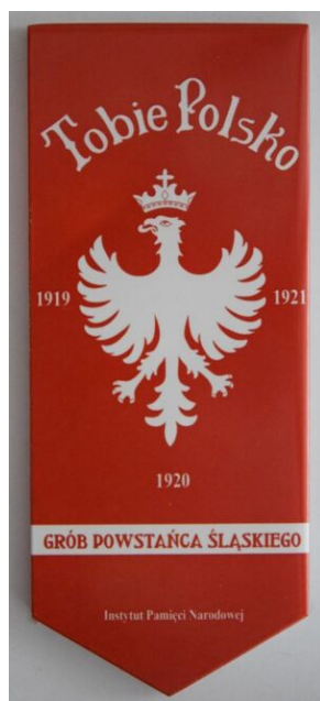
Znak pamięci „Tobie Polsko”.