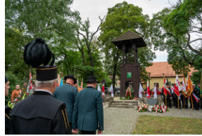
43. rocznica pierwszego strajku na Górnym Śląsku w tarnogórskim „Fazosie” - Tarnowskie Góry, 21 sierpnia 2023