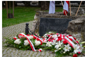
43. rocznica pierwszego strajku na Górnym Śląsku w tarnogórskim „Fazosie” - Tarnowskie Góry, 21 sierpnia 2023