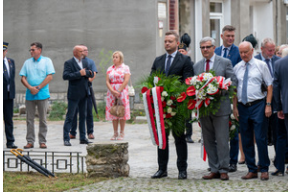
43. rocznica pierwszego strajku na Górnym Śląsku w tarnogórskim „Fazosie” - Tarnowskie Góry, 21 sierpnia 2023