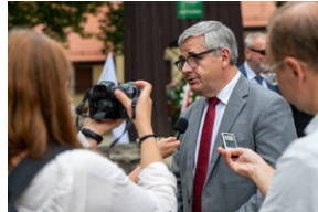
43. rocznica pierwszego strajku na Górnym Śląsku w tarnogórskim „Fazosie” - Tarnowskie Góry, 21 sierpnia 2023