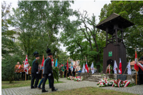
43. rocznica pierwszego strajku na Górnym Śląsku w tarnogórskim „Fazosie” - Tarnowskie Góry, 21 sierpnia 2023 - Fot.: K. Łojko