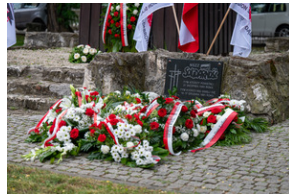
43. rocznica pierwszego strajku na Górnym Śląsku w tarnogórskim „Fazosie” - Tarnowskie Góry, 21 sierpnia 2023 - Fot.: K. Łojko