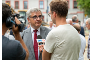
43. rocznica pierwszego strajku na Górnym Śląsku w tarnogórskim „Fazosie” - Tarnowskie Góry, 21 sierpnia 2023