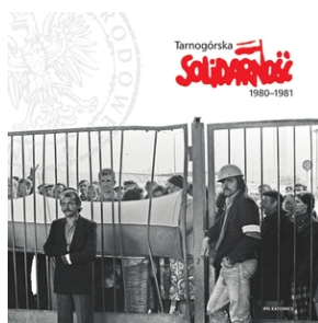
43. rocznica pierwszego strajku na Górnym Śląsku w tarnogórkim „Fazosie” - Tarnowskie Góry, 21 sierpnia 2023

Polecamy publikację wydaną wspólnie przez IPN, Śląskie Centrum Wolności i Solidarności oraz „Solidarność” w Tarnowskich Górach „ Tarnogórska Solidarność 1980-1990 ”. Instytut Pamięci Narodowej opublikował przed kilku laty również album „ Tarnogórska Solidarność 1980-1981 ” autorstwa Roberta Ciupy i Sebastiana Rosenbauma, poświęcony wczesnemu okresowi tarnogórskiej „Solidarności”.