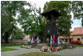
43. rocznica pierwszego strajku na Górnym Śląsku w tarnogórskim „Fazosie” - Tarnowskie Góry, 21 sierpnia 2023