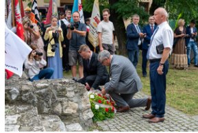
43. rocznica pierwszego strajku na Górnym Śląsku w tarnogórskim „Fazosie” - Tarnowskie Góry, 21 sierpnia 2023