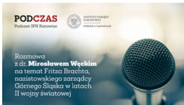
PodCzas - Podcast IPN Katowice - Fritz Bracht - nazistowski zarządca Górnego Śląska w czasie II wojny światowej, 5 lipca 2023

„PodCzas. Podcast IPN Katowice” poświęcony jest historii Górnego Śląska w XX wieku. Rozmawiamy o postaciach i wydarzeniach z niełatwych i nieraz zagmatwanych dziejów tego regionu. Interesuje nas wielka historia i zwykła codzienność. Mówimy zarówno o zjawiskach znanych, jak i mało popularnych. Zawsze o takich, w których odbija się specyfika XX-wiecznej historii Górnego Śląska, Polski i Europy: totalitaryzmy, wojny, przemiany kulturowe i społeczne. Podcast to projekt Oddziałowego Biura Badań Historycznych Instytutu Pamięi Narodowej w Katowicach pod patronatem wydawanego przez nas półrocznika popularnonaukowego „CzasyPismo”.