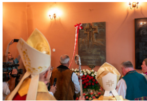
Narodowy Dzień Powstań Śląskich – Katowice, 20 czerwca 2023.