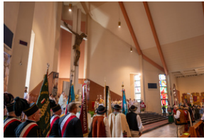
Narodowy Dzień Powstań Śląskich – Katowice, 20 czerwca 2023.