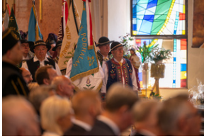
Narodowy Dzień Powstań Śląskich – Katowice, 20 czerwca 2023.