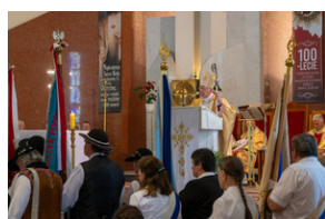
Narodowy Dzień Powstań Śląskich - Katowice, 20 czerwca 2023.