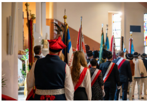
Narodowy Dzień Powstań Śląskich – Katowice, 20 czerwca 2023.