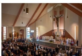
Narodowy Dzień Powstań Śląskich - Katowice, 20 czerwca 2023.