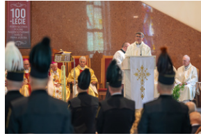
Narodowy Dzień Powstań Śląskich – Katowice, 20 czerwca 2023.