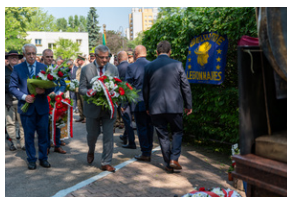
Narodowy Dzień Powstań Śląskich - Katowice, 20 czerwca 2023.