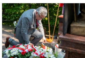
Narodowy Dzień Powstań Śląskich - Katowice, 20 czerwca 2023.