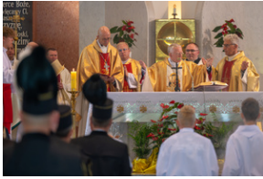
Narodowy Dzień Powstań Śląskich – Katowice, 20 czerwca 2023.