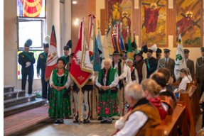
Narodowy Dzień Powstań Śląskich – Katowice, 20 czerwca 2023.