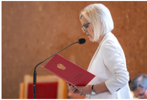
Narodowy Dzień Powstań Śląskich – Katowice, 20 czerwca 2023.