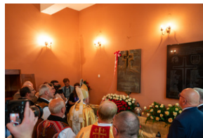
Narodowy Dzień Powstań Śląskich – Katowice, 20 czerwca 2023.