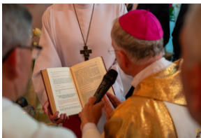
Narodowy Dzień Powstań Śląskich – Katowice, 20 czerwca 2023.