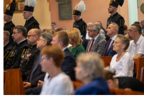
Narodowy Dzień Powstań Śląskich – Katowice, 20 czerwca 2023.