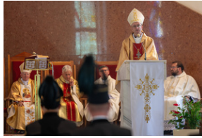
Narodowy Dzień Powstań Śląskich – Katowice, 20 czerwca 2023.