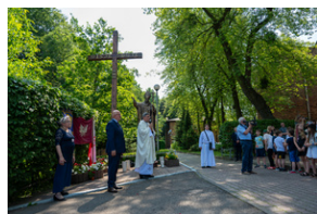
Narodowy Dzień Powstań Śląskich - Katowice, 20 czerwca 2023.

do dodatku prasowego z 2022 r. „ Do Polski! 1922 - Przyłączenie części Górnego Śląska do II Rzeczypospolitej ”