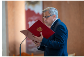
Narodowy Dzień Powstań Śląskich – Katowice, 20 czerwca 2023.