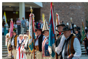
Narodowy Dzień Powstań Śląskich - Katowice, 20 czerwca 2023.