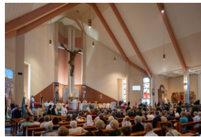
Narodowy Dzień Powstań Śląskich – Katowice, 20 czerwca 2023.