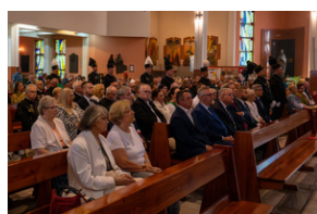
Narodowy Dzień Powstań Śląskich - Katowice, 20 czerwca 2023.