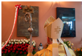
Narodowy Dzień Powstań Śląskich – Katowice, 20 czerwca 2023.