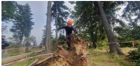
XXII Rajd Historyczno-Turystyczny „Na straży granic. Formacje graniczne II Rzeczypospolitej”.