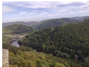
XXII Rajd Historyczno-Turystyczny „Na straży granic. Formacje graniczne II Rzeczypospolitej”.