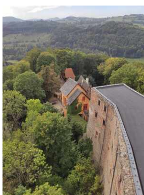
XXII Rajd Historyczno-Turystyczny „Na straży granic. Formacje graniczne II Rzeczypospolitej”.