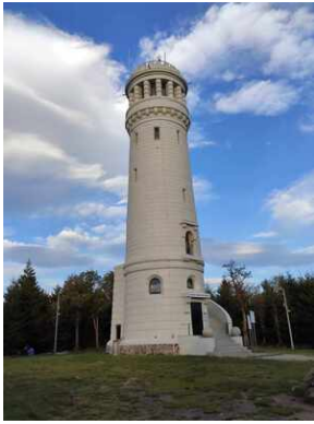
XXII Rajd Historyczno-Turystyczny „Na straży granic. Formacje graniczne II Rzeczypospolitej”.