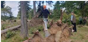
XXII Rajd Historyczno-Turystyczny „Na straży granic. Formacje graniczne II Rzeczypospolitej”.