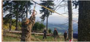
XXII Rajd Historyczno-Turystyczny „Na straży granic. Formacje graniczne II Rzeczypospolitej”.