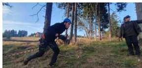
XXII Rajd Historyczno-Turystyczny „Na straży granic. Formacje graniczne II Rzeczypospolitej”.