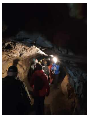
XXII Rajd Historyczno-Turystyczny „Na straży granic. Formacje graniczne II Rzeczypospolitej”.