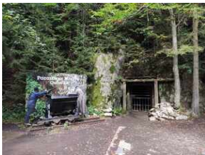
XXII Rajd Historyczno-Turystyczny „Na straży granic. Formacje graniczne II Rzeczypospolitej”.