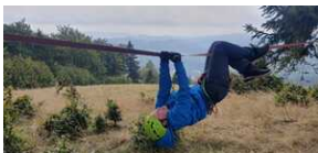
XXII Rajd Historyczno-Turystyczny „Na straży granic. Formacje graniczne II Rzeczypospolitej”.