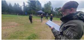
XXII Rajd Historyczno-Turystyczny „Na straży granic. Formacje graniczne II Rzeczypospolitej”.