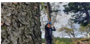
XXII Rajd Historyczno-Turystyczny „Na straży granic. Formacje graniczne II Rzeczypospolitej”