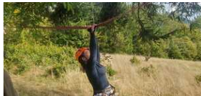
XXII Rajd Historyczno-Turystyczny „Na straży granic. Formacje graniczne II Rzeczypospolitej”.