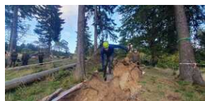
XXII Rajd Historyczno-Turystyczny „Na straży granic. Formacje graniczne II Rzeczypospolitej”.