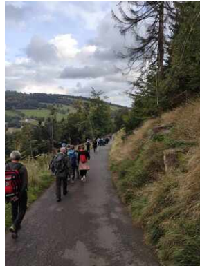
XXII Rajd Historyczno-Turystyczny „Na straży granic. Formacje graniczne II Rzeczypospolitej”.