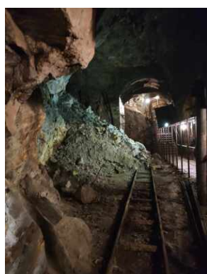
XXII Rajd Historyczno-Turystyczny „Na straży granic. Formacje graniczne II Rzeczypospolitej”.

4 października młodzież zwiedziła Sztolnie Walimskie w Rzeczcze, następnie przechodząc górami, Kompleks Osówka. Dalej szlakiem grupa wróciła do schroniska Orzeł.