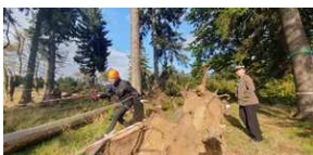
XXII Rajd Historyczno-Turystyczny „Na straży granic. Formacje graniczne II Rzeczypospolitej”.

5 października w rejonie schroniska Orzeł odbyły się zmagania drużyn w konkursach sprawnościowych przygotowanych przez harcerzy z Boguszowickiego Stowarzyszenia Kulturalno- Oświatowego „Ślady”.