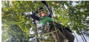
XXII Rajd Historyczno-Turystyczny „Na straży granic. Formacje graniczne II Rzeczypospolitej”.