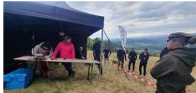
XXII Rajd Historyczno-Turystyczny „Na straży granic. Formacje graniczne II Rzeczypospolitej”.