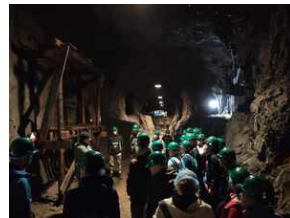
XXII Rajd Historyczno-Turystyczny „Na straży granic. Formacje graniczne II Rzeczypospolitej”.

5 października w rejonie schroniska Orzeł odbyły się zmagania drużyn w konkursach sprawnościowych przygotowanych przez harcerzy z Boguszowickiego Stowarzyszenia Kulturalno- Oświatowego „Ślady”.