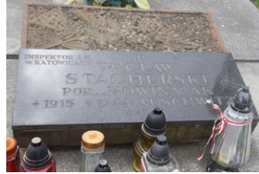
Spotkanie członków Komitetu Ochrony Pamięci Walk i Męczeństwa przy Oddziale IPN w Katowicach.