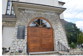
Spotkanie członków Komitetu Ochrony Pamięci Walk i Męczeństwa przy Oddziale IPN w Katowicach.