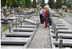
Spotkanie członków Komitetu Ochrony Pamięci Walk i Męczeństwa przy Oddziale IPN w Katowicach.