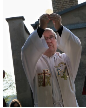
Wyjazd finalistów konkursu „W kręgu pamięci i prozy lagrowej więźniarek KL Ravensbrück”.