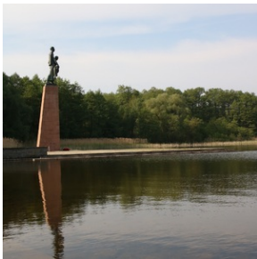
Wyjazd finalistów konkursu „W kręgu pamięci i prozy lagrowej więźniarek KL Ravensbrück”.