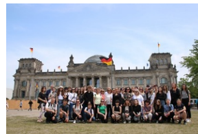
Wyjazd finalistów konkursu „W kręgu pamięci i prozy lagrowej więźniarek KL Ravensbrück”.