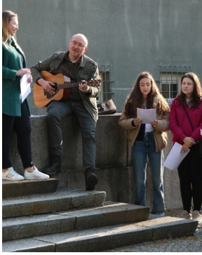
Wyjazd finalistów konkursu „W kręgu pamięci i prozy lagrowej więźniarek KL Ravensbrück”.