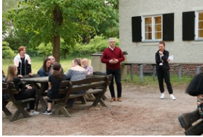
Wyjazd finalistów konkursu „W kręgu pamięci i prozy lagrowej więźniarek KL Ravensbrück”.