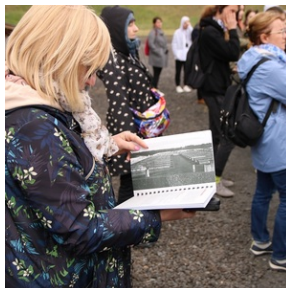
Wyjazd finalistów konkursu „W kręgu pamięci i prozy lagrowej więźniarek KL Ravensbrück”. Fot.