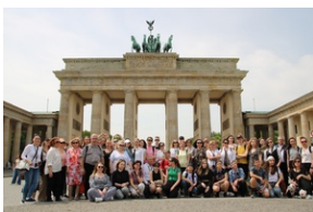
Wyjazd finalistów konkursu „W kręgu pamięci i prozy lagrowej więźniarek KL Ravensbrück”.