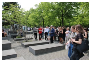
Wyjazd finalistów konkursu „W kręgu pamięci i prozy lagrowej więźniarek KL Ravensbrück”.