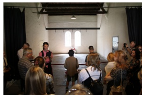
Wyjazd finalistów konkursu „W kręgu pamięci i prozy lagrowej więźniarek KL Ravensbrück”.