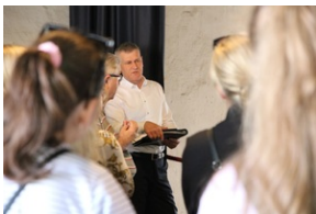
Wyjazd finalistów konkursu „W kręgu pamięci i prozy lagrowej więźniarek KL Ravensbrück”.