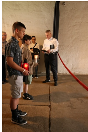
Wyjazd finalistów konkursu „W kręgu pamięci i prozy lagrowej więźniarek KL Ravensbrück”.