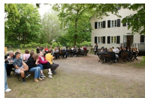
Wyjazd finalistów konkursu „W kręgu pamięci i prozy lagrowej więźniarek KL Ravensbrück”.