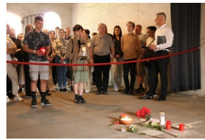
Wyjazd finalistów konkursu „W kręgu pamięci i prozy lagrowej więźniarek KL Ravensbrück”.