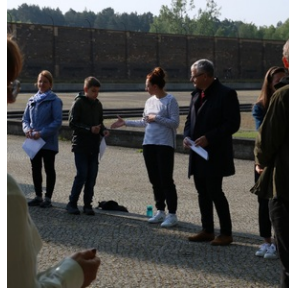
Wyjazd finalistów konkursu „W kręgu pamięci i prozy lagrowej więźniarek KL Ravensbrück”.