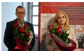
Wystawa „Jesteśmy Polakami! Związek Polaków w Niemczech” - Muzeum Miejskiego w Zabrzu. 20 maja 2023 r.