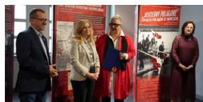
Wystawa „Jesteśmy Polakami! Związek Polaków w Niemczech” - Muzeum Miejskiego w Zabrzu. 20 maja 2023 r.