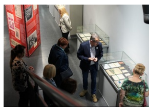
Wystawa „Jesteśmy Polakami! Związek Polaków w Niemczech” - Muzeum Miejskiego w Zabrzu. 20 maja 2023 r.