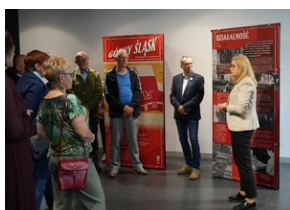
Wystawa „Jesteśmy Polakami! Związek Polaków w Niemczech” - Muzeum Miejskiego w Zabrzu. 20 maja 2023 r.