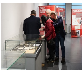
Wystawa „Jesteśmy Polakami! Związek Polaków w Niemczech” - Muzeum Miejskiego w Zabrzu. 20 maja 2023 r.