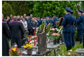
Zmarła Teresa Bracka.