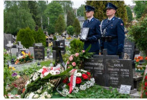
Zmarła Teresa Bracka.