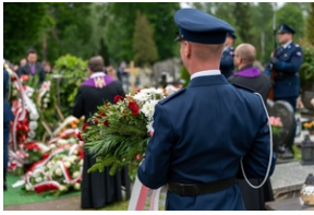
Zmarła Teresa Bracka.