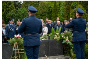
Zmarła Teresa Bracka.