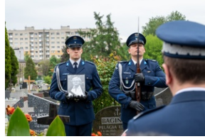
Zmarła Teresa Bracka.