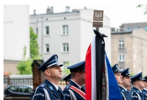
Zmarła Teresa Bracka.