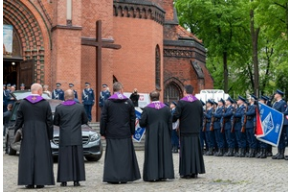
Zmarła Teresa Bracka.