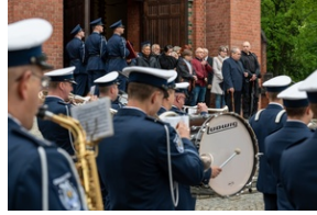
Zmarła Teresa Bracka.