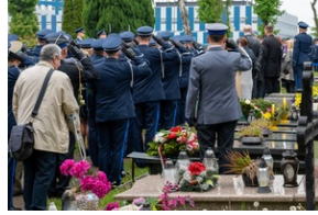
Zmarła Teresa Bracka.