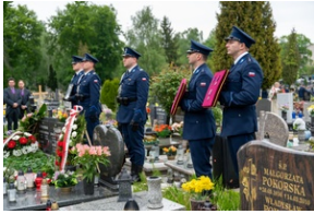
Zmarła Teresa Bracka.