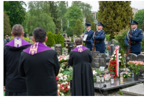
Zmarła Teresa Bracka.