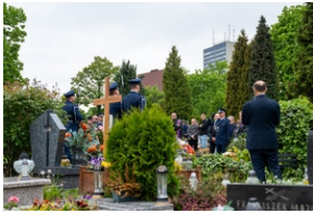
Zmarła Teresa Bracka.