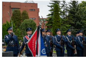
Zmarła Teresa Bracka.