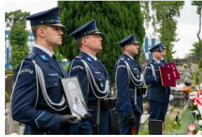
Zmarła Teresa Bracka.