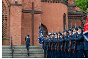
Zmarła Teresa Bracka.