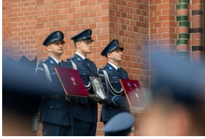
Zmarła Teresa Bracka.