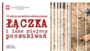
Projekt edukacyjny „Łączka i inne miejsca poszukiwań” – Katowice, 15 lutego 2023