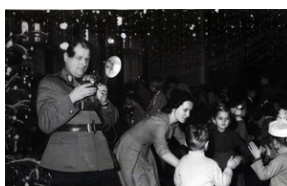
Spotkanie dzieci funkcjonariuszy z Dziadkiem Mrozem, początek lat 60-tych XX