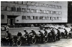
Podczas zabezpieczenia imprezy masowej, przełom lat 50-tych i 60-tych XX wieku. W tle pl. Feliksa Dzierżyńskiego w Katowicach (dziś Plac Sejmu Śląskiego).