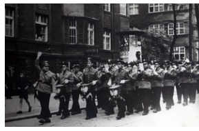
Orkiestra dęta katowickiego ZOMO, przełom lat 50-tych i 60-tych XX wieku. Czy ktoś z Czytelników rozpozna ten fragment ulicy w Katowicach?