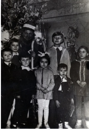
Spotkanie dzieci funkcjonariuszy z Dziadkiem Mrozem, początek lat 60-tych XX wieku.