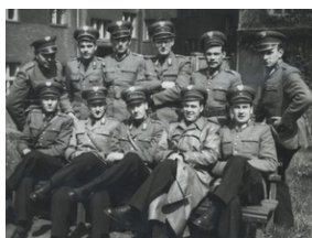
Funkcjonariusze ZOMO w Katowicach, koniec lat 50-tych XX w.