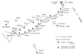
Trasa pieszej ewakuacji więźniów obozu Auschwitz do Wodzisławia Śląskiego w styczniu 1945 r. Mapa z wydawnictwa Towarzystwa Opieki nad Oświęcimiem, Katowice 2007.

Pszczyna – zbiorowa mogiła ofiar „marszu śmierci”; znajduje się na cmentarzu św. Krzyża przy ul. Żorskiej (GPS: 49.982044, 18.930078).