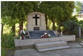
Świerklany – grób zbiorowy wojenny więźniów obozu KL Auschwitz zamordowanych 18 stycznia 1945 r.; znajduje się na cmentarzu przykościelnym.

18 stycznia 1945 r. drogą z Roju (obecnie Żory) przez Świerklany przechodziła kolumna więźniów oświęcimskich. Tych, którzy nie byli w stanie iść dalej, Niemcy mordowali strzałem w tył głowy. Zwłoki 13 osób przy cmentarzu parafialnym pochowała miejscowa ludność, a w 1948 r. ufundowała pomnik.