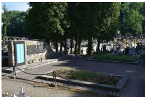
Pszczyna – zbiorowa mogiła ofiar „marszu śmierci”; znajduje się na cmentarzu św. Krzyża przy ul. Żorskiej.

Pszczyna była ważnym punktem trasy ewakuacyjnej więźniów niemieckiego obozu KL Auschwitz. W tym mieście kolumny z maszerującymi więźniami rozdzielały się. Część z nich kierowała się dalej drogą na Porębę i Jastrzębie-Zdrój. Inne szły na Żory i Świerklany. Pszczyna, jak i wiele innych miejsc „marszu śmierci” została naznaczona krwią. Dziś świadczy o tym między innymi zbiorowy grób wojenny na cmentarzu parafialnym przy ul. Żorskiej. Spoczywają w nim osoby, których zwłoki odnaleziono na ulicach Pszczyny, Radostowic, Kobielic oraz ekshumowane i przeniesione z Poręby.