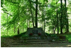
Suszec – pomnik, w którym została umieszczona urna z prochami więźniów; znajduje się w lesie przy ulicy Pszczyńskiej.

Żory – grób zbiorowy wojenny 23 więźniów KL Auschwitz poległych podczas "marszu śmierci" 17 stycznia 1945 r.; znajduje się na cmentarzu parafialnym przy ul. Nowej (GPS: 50.040419, 18.694309).