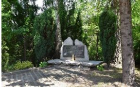
Żory-Rój – głaz z tablicą poświęcony 24 więźniom zamordowanym w Rogoźnej i Roju podczas „marszu śmierci” w styczniu 1945 r.; znajduje się przy ul. Wodzisławskiej.

Świerklany – grób zbiorowy wojenny więźniów obozu KL Auschwitz zamordowanych 18 stycznia 1945 r.; znajduje się na cmentarzu przykościelnym (GPS: 50.018159, 18.580879).