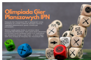
I Olimpiada Gier Planszowych IPN w Katowicach

się na rozgrywkę pokazową! Na stronie https://olimpiadagier.org/ znajduje się pełen pakiet szczegółowych informacji o tym wyjątkowym wydarzeniu i prosty link do zapisów.