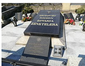
K. Zenkteller - grób 2