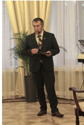
Odstąpienie obelisku w Zakładzie Karnym w Nowym Łupkowie, 30 września 2022