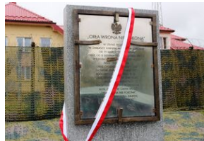
Odstąpienie obelisku w Zakładzie Karnym w Nowym Łupkowie, 30 września 2022