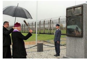
Odstąpienie obelisku w Zakładzie Karnym w Nowym Łupkowie, 30 września 2022