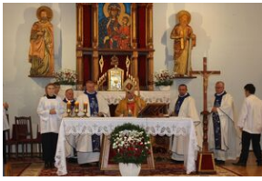
Odstąpienie obelisku w Zakładzie Karnym w Nowym Łupkowie, 30 września 2022