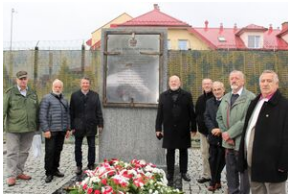
Odstąpienie obelisku w Zakładzie Karnym w Nowym Łupkowie, 30 września 2022