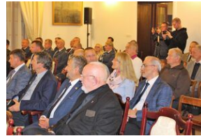
Odstąpienie obelisku w Zakładzie Karnym w Nowym Łupkowie, 30 września 2022