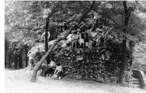
Zbiory Archiwum IPN w Katowicach o sygn. IPN Ka 030/208