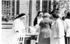
Zbiory Archiwum IPN w Katowicach o sygn. IPN Ka 030/208