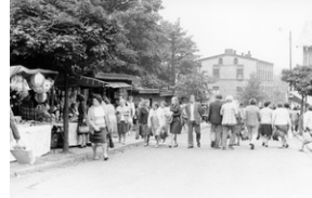
Zbiory Archiwum IPN w Katowicach o sygn. IPN Ka 030/208