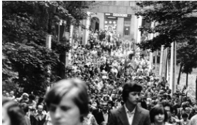
Zbiory Archiwum IPN w Katowicach o sygn. IPN Ka 030/208