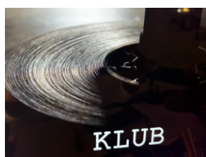
Film „Klub” zostanie zaprezentowany na VI Ogólnopolskim Festiwalu Filmów Satyrycznych w Mogilnie

Od 16 do 19 czerwca w Mogilnie odbędzie się VI edycja Ogólnopolskiego Festiwalu Filmów Satyrycznych Pyszadło. W czasie festiwalu zostanie zaprezentowany film „Klub”, wyprodukowany przez TVP 3 Katowice przy współpracy z katowickim Oddziałem IPN.