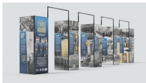
Wystawa plenerowa „»Pamiętaj, że nosisz mundur« Policja Województwa Śląskiego w stulecie utworzenia”.

Koloryzacja zdjęcia na planszy tytułowej: Mikołaj Kaczmarek