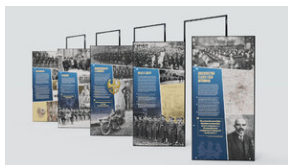
Wystawa plenerowa „»Pamiętaj, że nosisz mundur« Policja Województwa Śląskiego w stulecie utworzenia”.