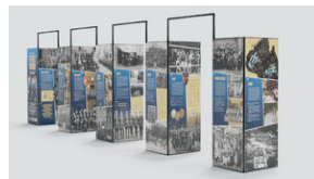
Wystawa plenerowa „»Pamiętaj, że nosisz mundur« Policja Województwa Śląskiego w stulecie utworzenia”.