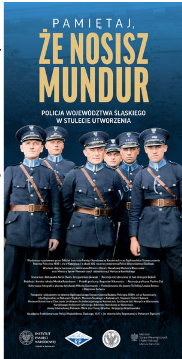
Wystawa plenerowa „»Pamiętaj, że nosisz mundur« Policja Województwa Śląskiego w stulecie utworzenia”.

Wystawa objęta jest honorowym patronatem Ministra Obrony Narodowej Mariusza