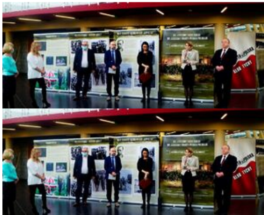
W ramach obchodów Narodowego Dnia Pamięci „Żołnierzy Wyklętych” 26 lutego 2022 r., o