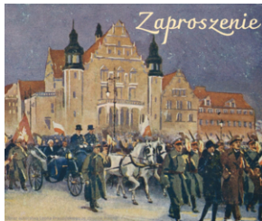
Otwarcie wystawy „Powstanie wielkopolskie 1918-1919”