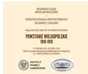
Otwarcie wystawy „Powstanie wielkopolskie 1918-1919”