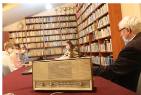
IV edycja Gry Miejskiej „Tropami Solidarności”.