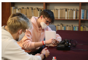
IV edycja Gry Miejskiej „Tropami Solidarności”.