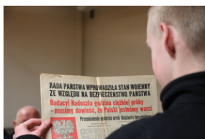
IV edycja Gry Miejskiej „Tropami Solidarności”.