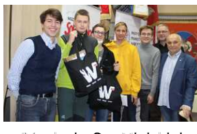
IV edycja Gry Miejskiej „Tropami Solidarności”.