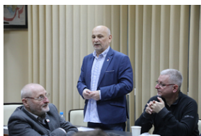
IV edycja Gry Miejskiej „Tropami Solidarności”.