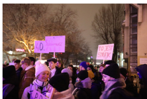
IV edycja Gry Miejskiej „Tropami Solidarności”.