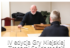
IV edycja Gry Miejskiej „Tropami Solidarności”.