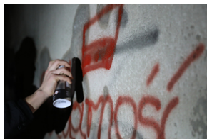
IV edycja Gry Miejskiej „Tropami Solidarności”.