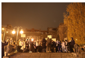
IV edycja Gry Miejskiej „Tropami Solidarności”.