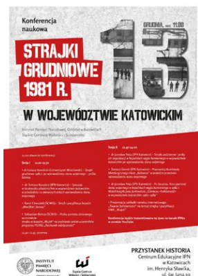
Konferencja naukowa „Strajki grudniowe 1981 r. w województwie katowickim” (plakat).