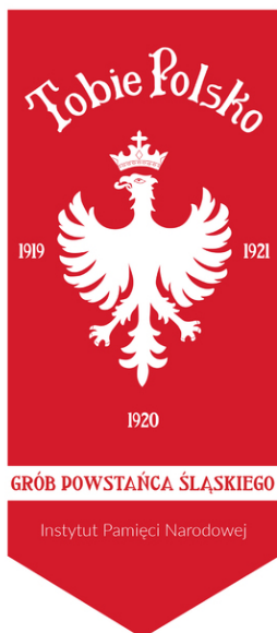
Znak pamięci "Tobie Polsko".

napisy „Grób Powstańca Śląskiego” i „Instytut Pamięci Narodowej”. Proporzec jest wzorowany na sztandarze powstańczym „Tobie Polsko”, który wykonano na początku 1920 r. w pracowni przy redakcji „Katolika” w Bytomiu i który obecnie znajduje się w zbiorach Muzeum Czynu Powstańczego w Górze Św. Anny. Muzeum posiada także fotografię z uroczystości upamiętniającej uchwalenie Konstytucji 3 Maja, która przedstawia pochód mieszkańców wsi Osiek (pow. strzelecki, woj. opolskie) z tymże sztandarem niesionym przez A. Szulca do Rozmierzy. Uroczystości te obchodzono na całym Górnym Śląsku w niedzielę 2 maja 1920 r. i były to pierwsze legalne obchody tej rocznicy na tym terenie. Dzięki postanowieniom artykułu 88 Traktatu Wersalskiego o przeprowadzeniu plebiscytu, dla zapewnienia jego bezstronności, w lutym 1920 r. obszar plebiscytowy wyłączono z państwa niemieckiego i poddano kontroli wojsk alianckich, a pełnię władzy przejęła na nim Międzysojusznicza Komisja Rządząca i Plebiscytowa Górnego Śląska z gen. Henri Le Rondem na czele. Umożliwiło to Polakom legalne demonstrowanie swoich dążeń i używanie symboli narodowych.