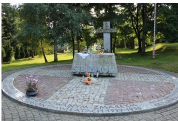
Pomnik Sybiraków w Bielsku-Białej.