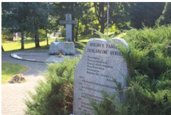
Pomnik Sybiraków w Bielsku-Białej.

Uroczystości te, w których wziął udział także przedstawiciel katowickiego Oddziału Instytutu Pamięci Narodowej odbyły się pod pomnikiem Sybiraków, znajdującym się na cmentarzu komunalnym w Bielsku-Białej Kamienicy.