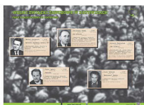
Wystawa „W walce o lepszą przyszłość. Wolne Związki Zawodowe 1978-1980”.

Polecamy portal poświęconym Wolnym Związkom Zawodowym na Górnym Śląsku