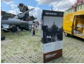
Wystawa „Powstania śląskie 1919-1921” w Koszalinie, 12 sierpnia - 30 września 2021