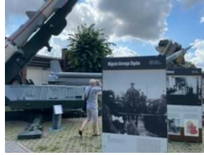
Wystawa „Powstania śląskie 1919-1921” w Koszalinie, 12 sierpnia - 30 września 2021

Po I wojnie światowej, na mocy traktatu wersalskiego z 28 czerwca 1919 r., zdecydowano, że o przyszłości Górnego Śląska, znajdującego się do tej pory w granicach państwa niemieckiego, postanowi plebiscyt, w którym uprawnieni ku temu mieszkańcy regionu oddadzą głos za jego przynależnością do Niemiec lub do Polski. Na górnośląskim obszarze plebiscytowym rozpoczęła się kampania propagandowa prowadzona przez obie strony, mająca przekonać niezdecydowanych. Dramatyczny przebieg konfliktu o Górny Śląsk spowodował konieczność trzykrotnego zrywu zbrojnego.