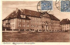
Budynek Seminarium Nauczycielskiego na pocztówce z 1931 r.