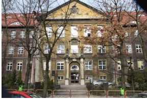
Siedziba Liceum Ogólnokształcącego w Mysłowicach (obecnie).