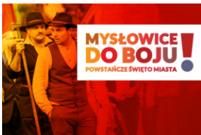
Plakat „Mysłowice do boju!”.