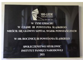
Tablica upamiętniająca siedzibę Głównego Szpitala Wojsk Powstańczych w Mysłowicach.

Wydarzenie zostało zorganizowane przez Oddział Instytutu Pamięci Narodowej w Katowicach oraz Urząd Miasta Mysłowice.