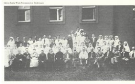
Pracownicy Głównego Szpitala Wojsk Powstańczych w Mysłowicach. Encyklopedia Powstań Śląskich.

Uroczystość odbyła się w ramach Powstańczego Święta Miasta pod hasłem „Mysłowice do boju!”, którego program prezentujemy poniżej.