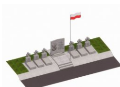
Projekt kwatery grobów wojennych „Żołnierzy Niezłomnych“ na katowickim cmentarzu komunalnym.