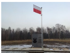
Pomnik „Gloria Victis“ przy kwaterze grobów wojennych „Żołnierzy Niezłomnych“ na