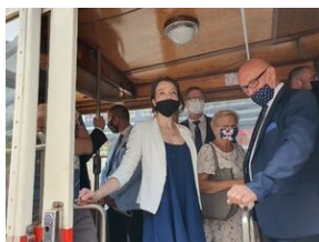
Tramwaj powstańczy do Niepodległej kursował w Katowicach.