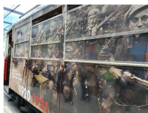
Tramwaj powstańczy do Niepodległej kursował w Katowicach.