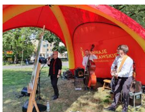
Tramwaj powstańczy do Niepodległej kursował w Warszawie.