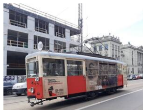
Tramwaj powstańczy do Niepodległej kursował w Katowicach.

Tramwaj kursował po wybranych miastach GZM w godzinach popołudniowych w dniach 17 - 25 sierpnia 2020 r.