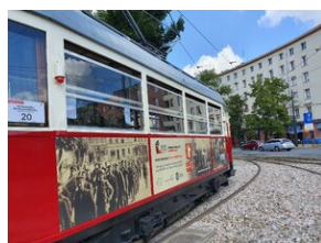
Niepodległej kursował w Warszawie.