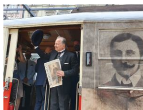
Tramwaj powstańczy do Niepodległej kursował w Katowicach.