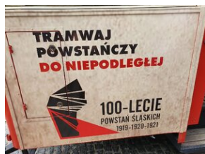
Tramwaj powstańczy do Niepodległej kursował w Katowicach.