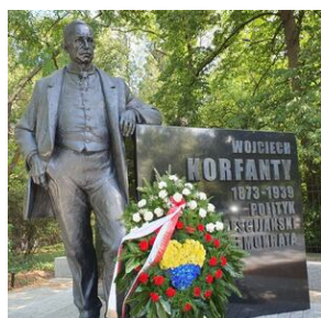
Tramwaj powstańczy do

Tramwaj kursował w Warszawie w dniach 20 – 25 sierpnia 2020 r.