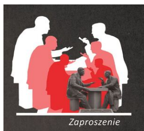
Film dokumentalny „Oto człowiek – rzecz o Henryku Sławiku i Józsefie Antallu”.

Film powstał w koprodukcji Instytutu Pamięci Narodowej z Telewizją Polską S.A. (2020 r.)