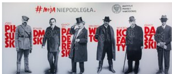
Prezentacja wydawnictw IPN poświęconych sześciu Ojcom Niepodległości.