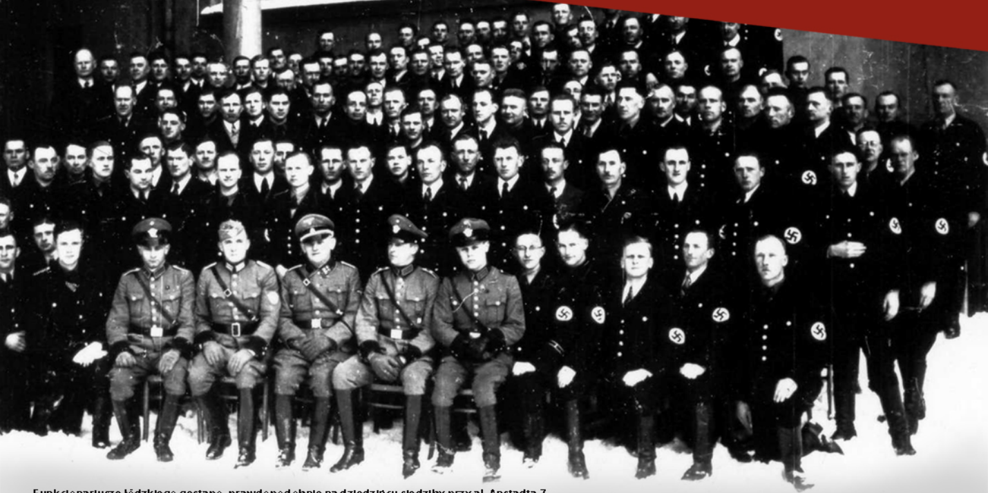
Funkcjonariusze łódzkiego gestapo, prawdopodobnie na dziedzińcu siedziby przy al. Anstadta 7

W listopadzie 1939 roku do działań przeciwko łódzkiej inteligencji włączyło się gestapo, rezydujące w nowoczesnym trzykondygnacyjnym Gimnazjum Męskim Towarzystwa Żydowskich Szkół Średnich przy al. Anstadta 7. Szefem placówki był SS-Sturmbannführer Gerhard Flesch (1909–1948), który we wrześniu 1939 roku dowodził jednym z Einsatzkommando w Wielkopolsce. Teraz miał decydować o życiu i śmierci osób ujętych w ramach Intelligenzaktion. Do dyspozycji miał przeszło stu funkcjonariuszy, którzy do Łodzi przybyli przede wszystkim z Wrocławia i z Frankfurtu nad Odrą.