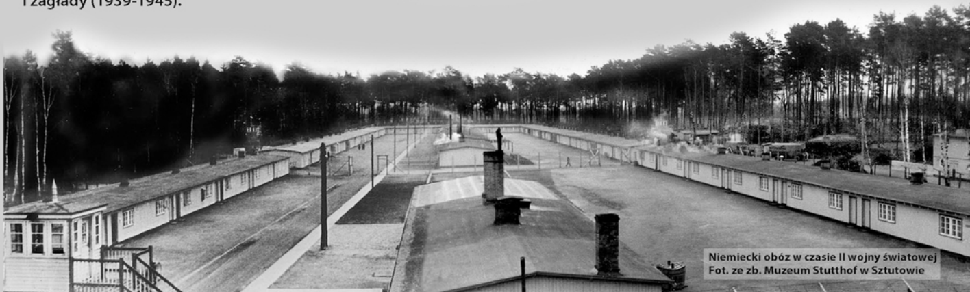
Niemiecki obóz w czasie II wojny światowej

Obecnie w miejscu tym zwiedzać można Muzeum Stutthof w Sztutowie. Niemiecki nazistowski obóz koncentracyjny i zagłady (1939-1945).