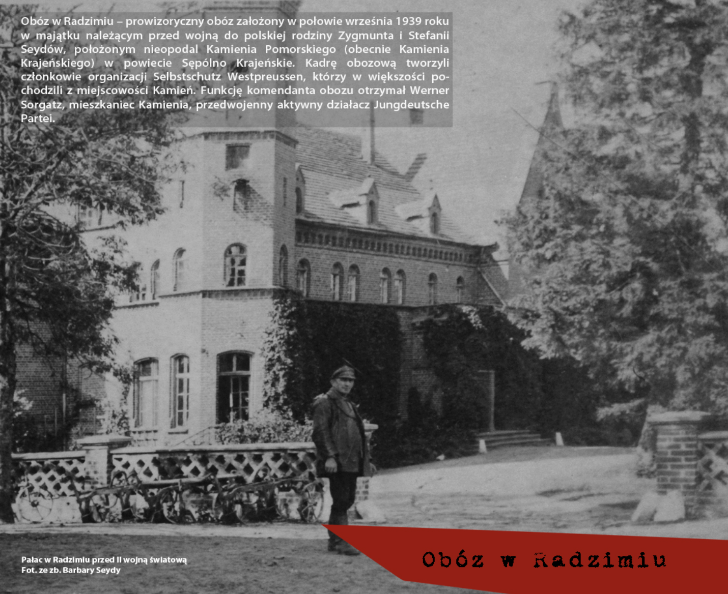
Pałac w Radzimiru przed II wojną światową