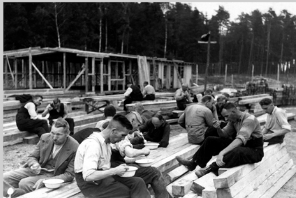
Niemiecki obóz w czasie II wojny światowej

Od 2 września 1939 r. komendantem obozu Stutthof był funkcjonariusz SS Max Pauly (Obersturmbannführer). Obozem centralnym był obóz w Nowym Porcie. Miał on być prowadzony do momentu ukończenia budowy Stutthofu, który do jesieni 1939 roku nosił nazwę obóz Jeńców Cywilnych Stutthof (Zivilgefangenlager Stutthof). Stosowano także nazwy: Obóz Koncentracyjny Stutthof (Konzentrationslager Stutthof) oraz Obóz Jeńców Stutthof (Gefangenlager Stutthof).