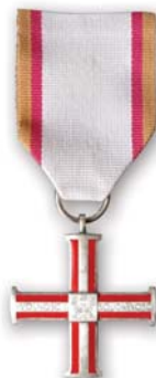
Krzyż Wolności i Solidarności