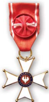
Krzyż Oficerski Orderu Odrodzenia Polski

Odznaczona pośmiertnie Krzyżem Oficerskim Orderu Odrodzenia Polski (2009) oraz Krzyżem Wolności i Solidarności (2010).