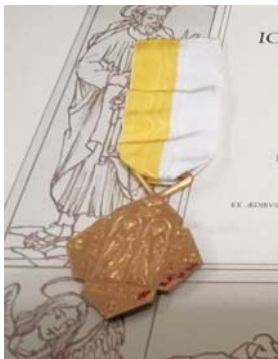
Medal Pro Ecclesia et Pontifice

Odznaczona medalem Pro Ecclesia et Pontifice (1994).