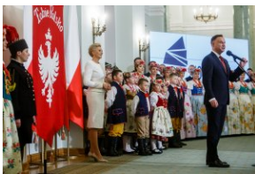
Spotkanie z Prezydentem RP Andrzejem Dudą i Pierwszą Damą Agatą Kornhauser-Dudą w Pałacu Prezydenckim.