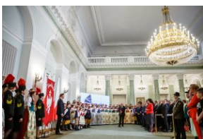
Spotkanie z Prezydentem RP Andrzejem Dudą i Pierwszą Damą Agatą Kornhauser-Dudą w Pałacu Prezydenckim.