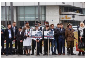
Uroczystość przy Grobie Nieznanego Żołnierza.