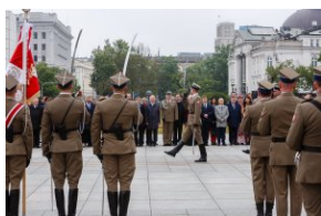
Uroczystość przy Grobie Nieznanego Żołnierza.