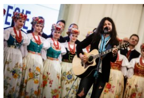
Spotkanie z Prezydentem RP Andrzejem Dudą i Pierwszą Damą Agatą Kornhauser-Dudą w Pałacu Prezydenckim.