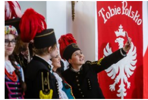
Spotkanie z Prezydentem RP Andrzejem Dudą i Pierwszą Damą Agatą Kornhauser-Dudą w Pałacu Prezydenckim.