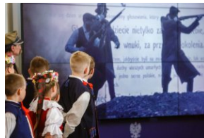
Spotkanie z Prezydentem RP Andrzejem Dudą i Pierwszą Damą Agatą Kornhauser-Dudą w Pałacu Prezydenckim.