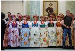
Spotkanie z Prezydentem RP Andrzejem Dudą i Pierwszą Damą Agatą Kornhauser-Dudą w Pałacu Prezydenckim.