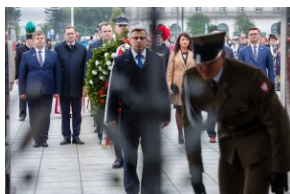
Uroczystość przy Grobie Nieznanego Żołnierza.