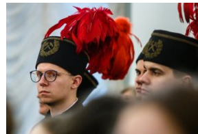
Spotkanie z Prezydentem RP Andrzejem Dudą i Pierwszą Damą Agatą Kornhauser-Dudą w Pałacu Prezydenckim.