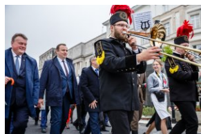
Przemarsz na pl. Piłsudskiego.