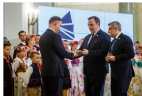
Spotkanie z Prezydentem RP Andrzejem Dudą i Pierwszą Damą Agatą Kornhauser-Dudą w Pałacu Prezydenckim.