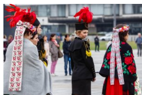
Uroczystość przy Grobie Nieznanego Żołnierza.