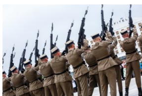
Uroczystość przy Grobie Nieznanego Żołnierza.