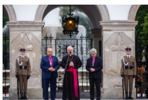
Uroczystość przy Grobie Nieznanego Żołnierza.