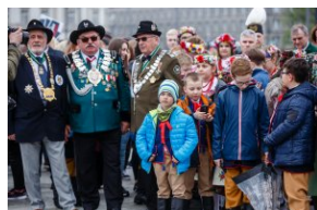
Uroczystość przy Grobie Nieznanego Żołnierza.