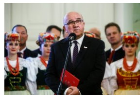
Spotkanie z Prezydentem RP Andrzejem Dudą i Pierwszą Damą Agatą Kornhauser-Dudą w Pałacu Prezydenckim.