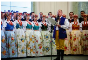
Spotkanie z Prezydentem RP Andrzejem Dudą i Pierwszą Damą Agatą Kornhauser-Dudą w Pałacu Prezydenckim.