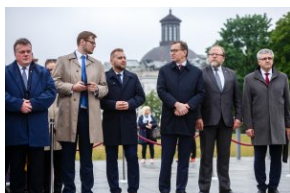
Uroczystość przy Grobie Nieznanego Żołnierza.