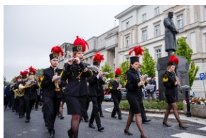
Przemarsz na pl. Piłsudskiego.

Uczestnicy wyjazdu przeszli następnie na pl. Piłsudskiego i wzięli udział w uroczystości przy Grobie Nieznanego Żołnierza.