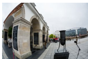
Uroczystość przy Grobie Nieznanego Żołnierza.