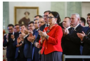
Spotkanie z Prezydentem RP Andrzejem Dudą i Pierwszą Damą Agatą Kornhauser-Dudą w Pałacu Prezydenckim.