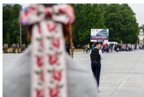
Przemarsz na pl. Piłsudskiego.