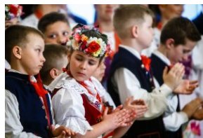
Spotkanie z Prezydentem RP Andrzejem Dudą i Pierwszą Damą Agatą Kornhauser-Dudą w Pałacu Prezydenckim.