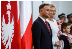
Spotkanie z Prezydentem RP Andrzejem Dudą i Pierwszą Damą Agatą Kornhauser-Dudą w Pałacu Prezydenckim.